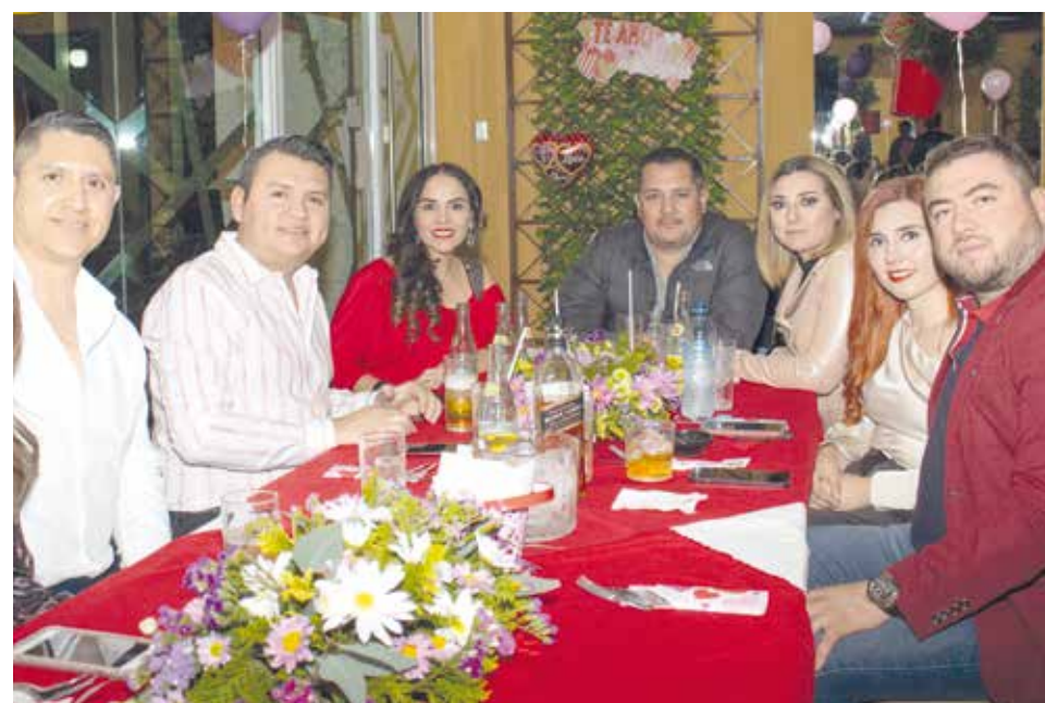
Algunos comensales y socios del Country Club Monclova que llegaron a restaurante La Mina para celebrar el amor y la amistad.