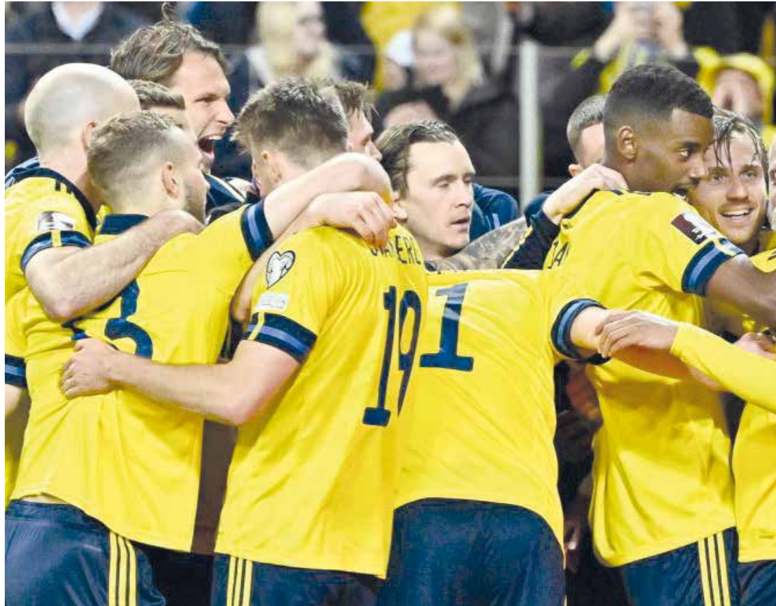
Los países con su clasificación a Qatar 2022.

FÚTBOL A meses de la Copa del Mundo, las confederaciones empiezan a definir a sus clasificados.