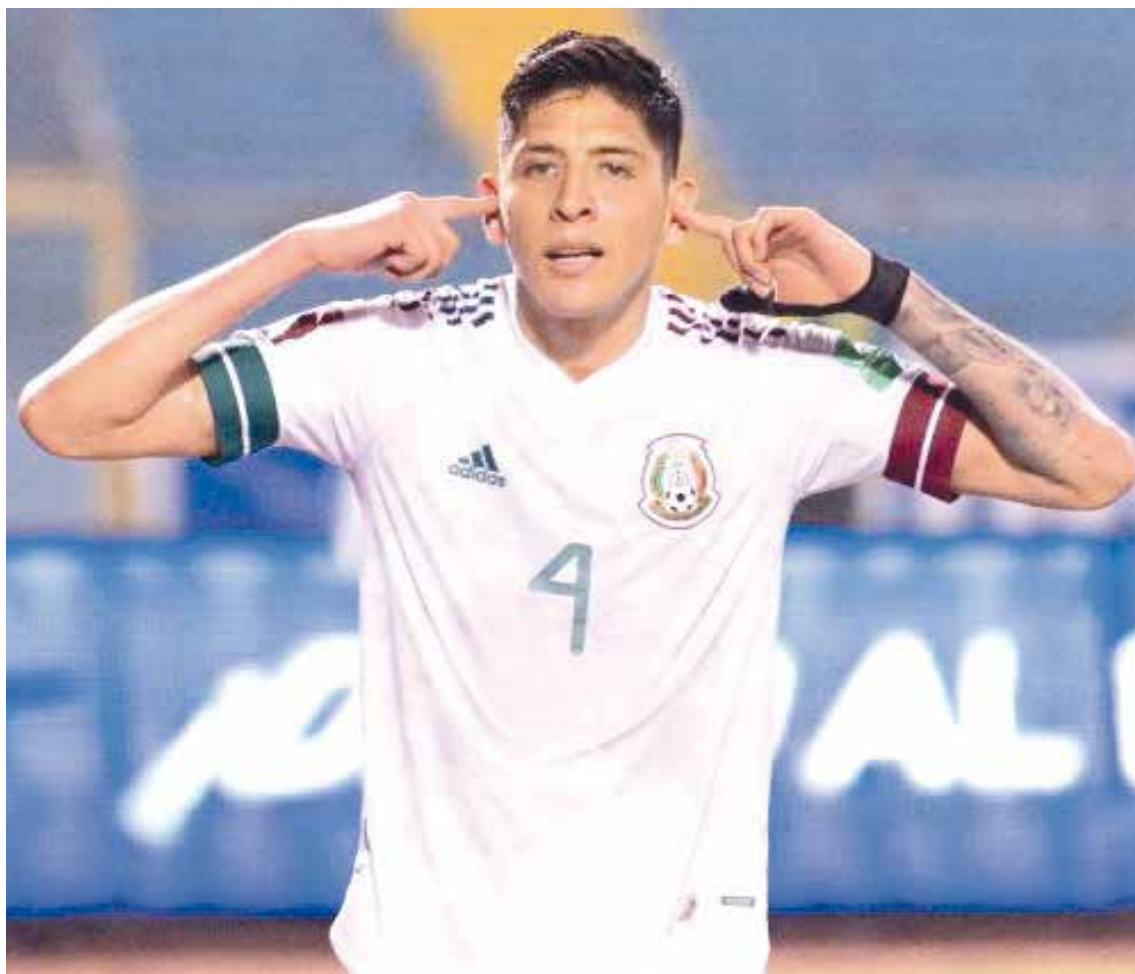
México con un pie en la clasificación rumbo a qatar 2022.