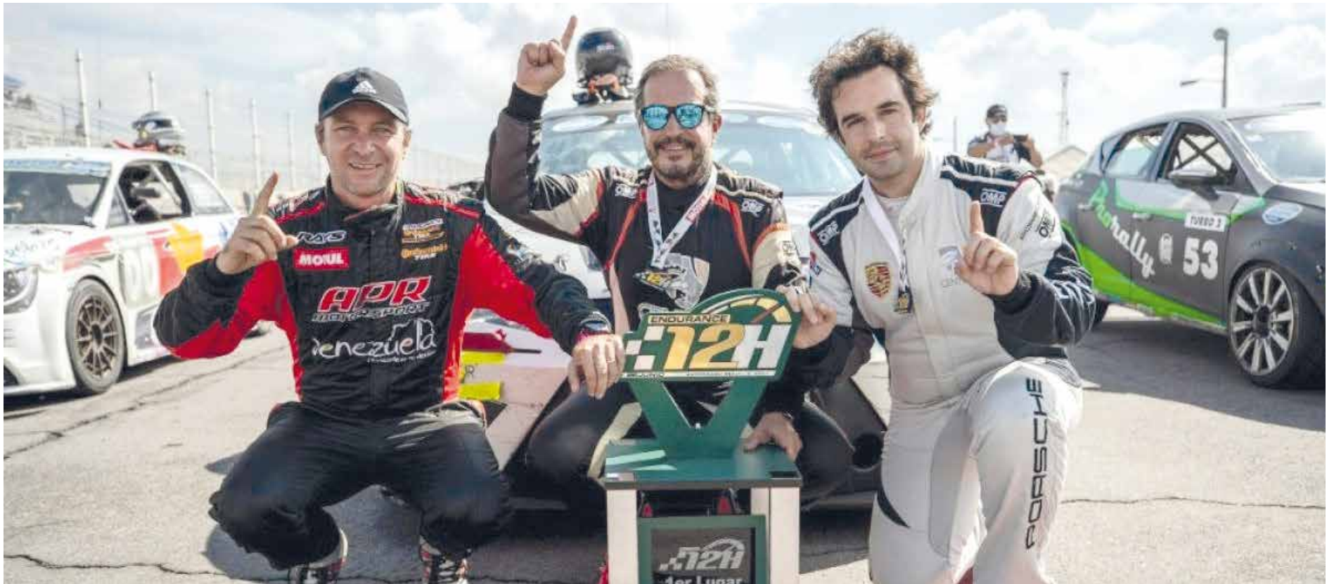
Los triunfadores de la carrera con sus trofeos en el podio.