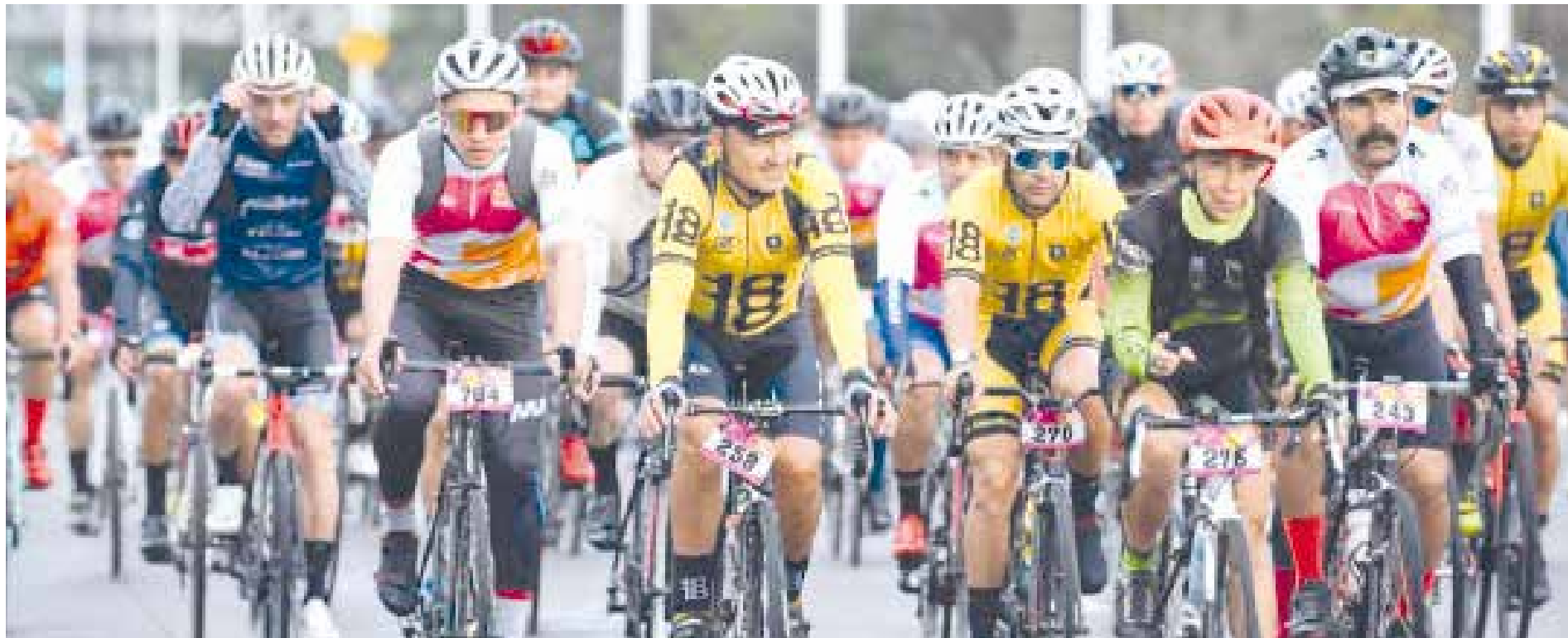
Momentos en que se efectuaba la salida del Gran giro de Guadalajara 2022.