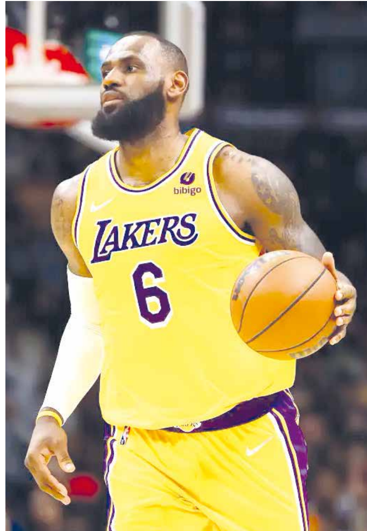
LeBron James sigue sobresaliendo.

NBA El cromo tiene incrustados parches con el logotipo de la NBA de camisetas usadas de los tres equipos de su carrera.