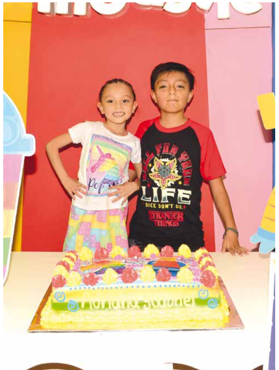
El amor de hermanos siempre perdura.