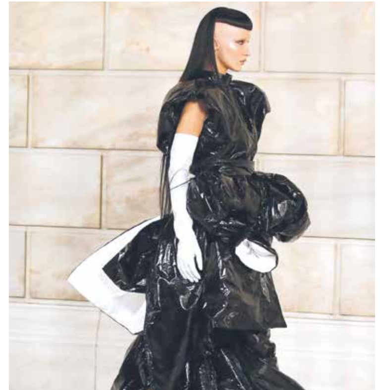
Un look fenomenal y fuera de lo habitual.

Recordemos que la Reina de España, fue la anfitriona de los invitados, periodistas y jefes de Estado que permanecieron en la capital ibérica en los últimos días. Para recibir a sus invitados e imprimirles una imagen positiva y soleada en su visita a España, Letizia eligió un look rosa total, gracias a un vestido acampanado y de botones forrados, indudablemente inspirado en los de corte New Look diseñados por Dior, en los 50. Este modelo le permitió reflejar su personalidad dinámica, pero siempre preppy y transmitir también su gran energía. Letizia (como la reina moderna que es) ama reutilizar, su ropa así que esta es la 'segunda salida' oficial de este vestido de la firma Carolina Herrera, que ya había sido utilizado para una reunión en Almagro, España, en Julio de 2019, en el marco del Consejo del Real Patronato sobre Discapacidad, una organización con la que colabora activamente.