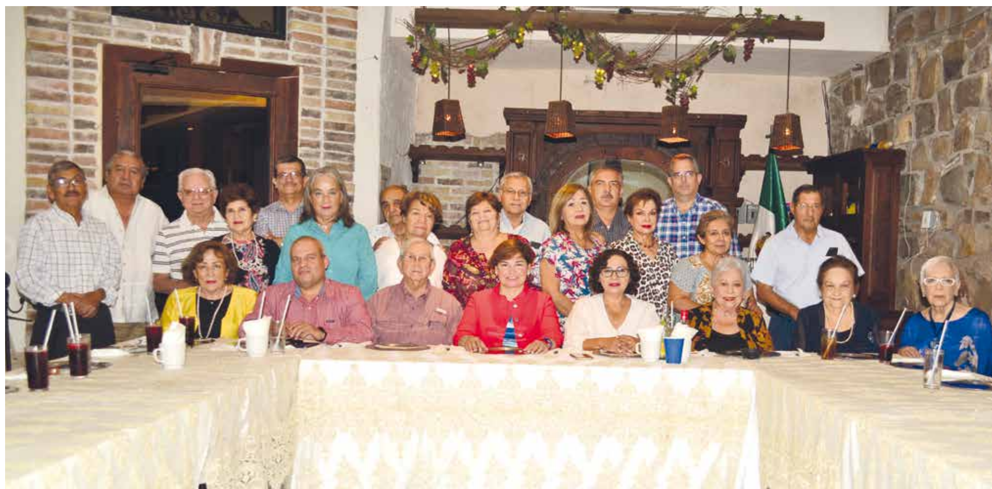
Juntos compartieron una increíble tarde llena de conocimientos y mucha inteligencia.