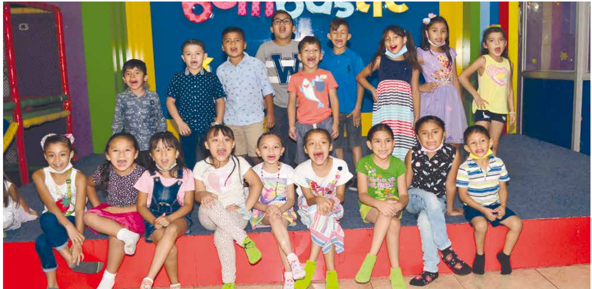
Los pequeños invitados disfrutaron de una magnífica tarde con los cumpleañeros.