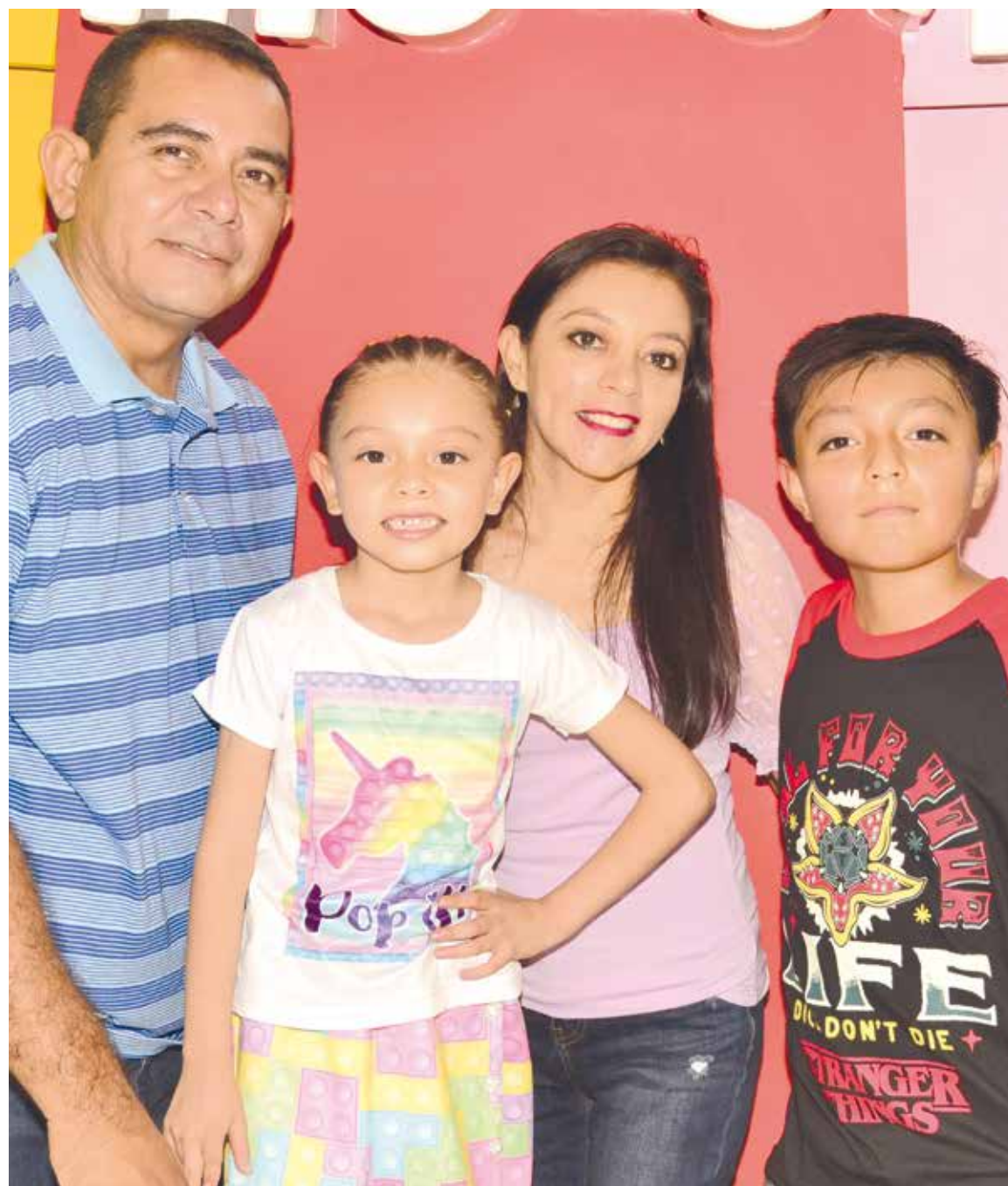
Los cumpleañeros agradecieron a sus papás por su bonito festejo.