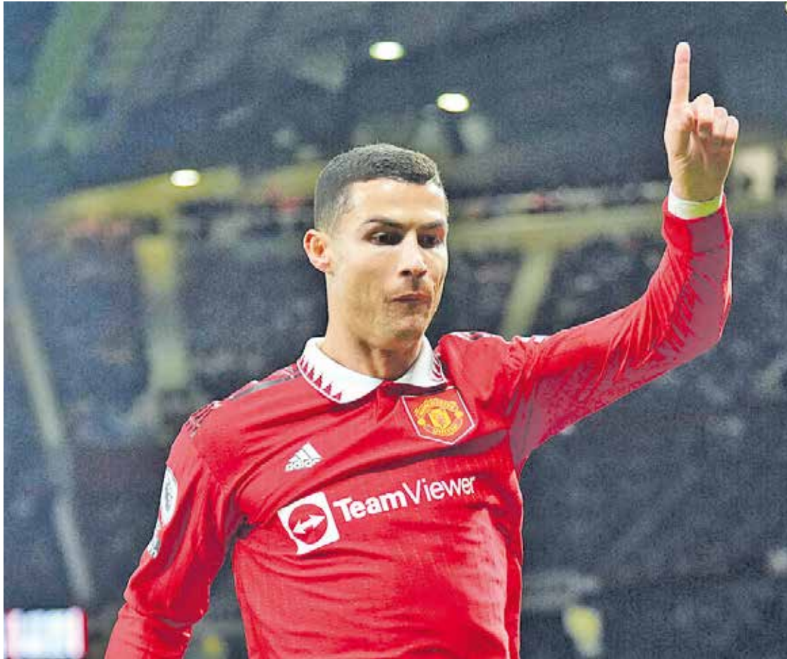
Cristiano Ronaldo regresa triunfante a la Europa League.

ANOTACIONES Después de quedar fuera en la convocatoria contra Chelsea, CR7 regresa titular en la Europa League.