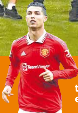
Ronaldo regresa a la titularidad con el Man U P.4