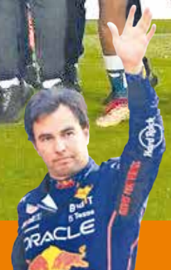
Sergio Pérez es sublíder del GP de México P.8