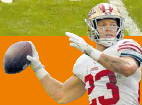
El corredor Christian McCaffrey hace historia P.5