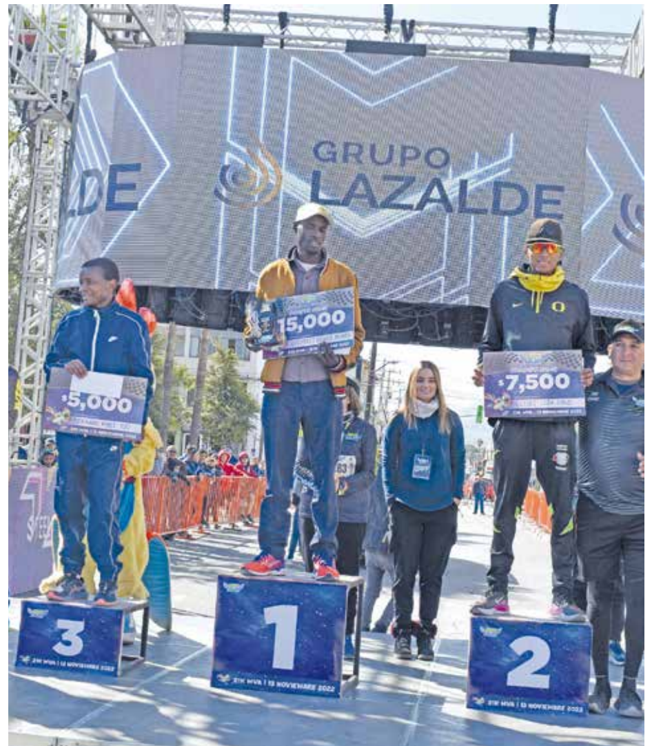
Los ganadores de la categoría libre.