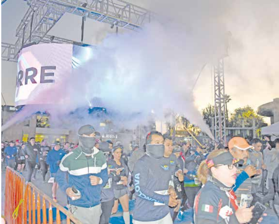
La foto para la historia, la salida del 21 k.

ATLETISMO Con una organización de primera el 21 K celebrado ayer.