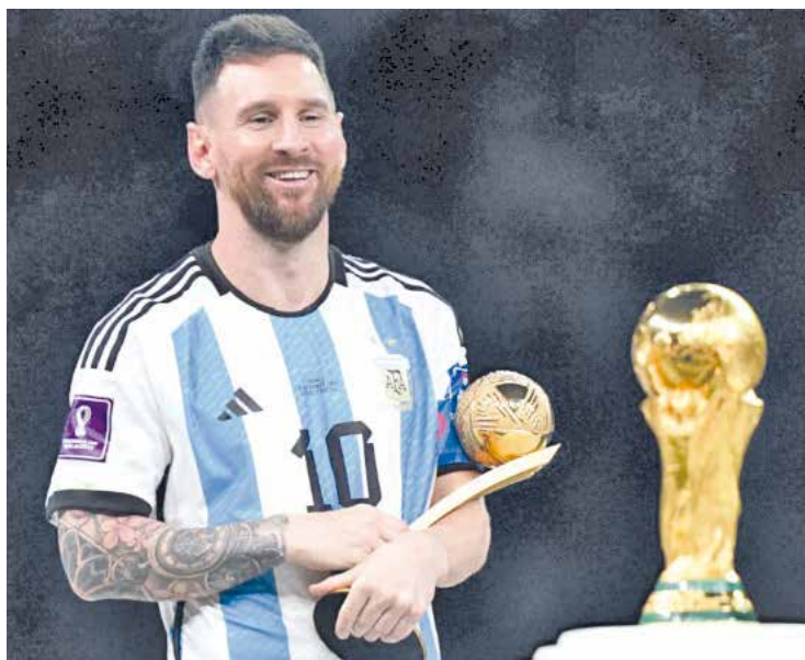
Messi se queda con la copa en su último mundial.

Los hinchas argentinos cantaron durante todo el Mundial una manda: "Quiero ganar la tercera, quiero ser campeón mundial". De un momento a otro, las palabras quedaron rebasadas, había que inventar algo nuevo. Argentina ganó la tercera y fue campeón mundial. La delgada línea de lo que significa un deseo que de pronto se hace realidad ejemplifica la vida de Lionel Messi, donde un título es capaz de cambiar la perspectiva en apenas un instante. El talento futbolístico que brota de sus piernas tiene tiempo que terminó con las dudas, el argentino era desde hace mucho parte de la casta más privilegiada del fútbol, pero le faltaba el título que convirtiera el