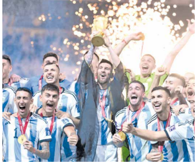
La Selección de Argentina se llevó ayer el título que le faltaba, Campeón del Mundo.