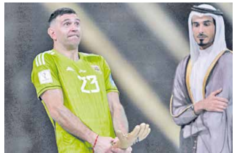
El festejo poco profesional de Dibu.

tina fue Campeón del Mundo Sub-20, también fue campeón olímpico, como una antesala de una gloria que se tardó en llegar más de la cuenta. Antes de Qatar 2022, Lionel solo había podido levantar la Copa América en el 2021, un título que le permitió sentirse campeón en un país que lo veía con cierta distancia. El genio que mostraba dentro de la cancha con los amagues y los pases y los goles encontró pronto su recompensa.