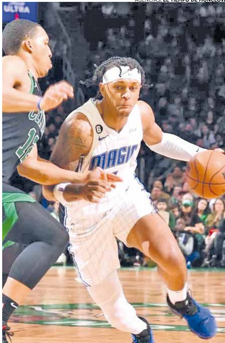
El Magic de Orlando suma cuatro victorias al hilo.

de Miami Heat contra San Antonio Spurs en Ciudad de México también se destacaron en una jornada en la que Dallas Mavericks cayó en la prórroga contra Cleveland Cavaliers, sin el esloveno Luka Doncic. Booker selló la tercera mejor actuación de su carrera, tras anotar 70 puntos contra Boston Celtics en 2017 y 59 ante Utah Jazz en 2019, y guió la remontada de 24