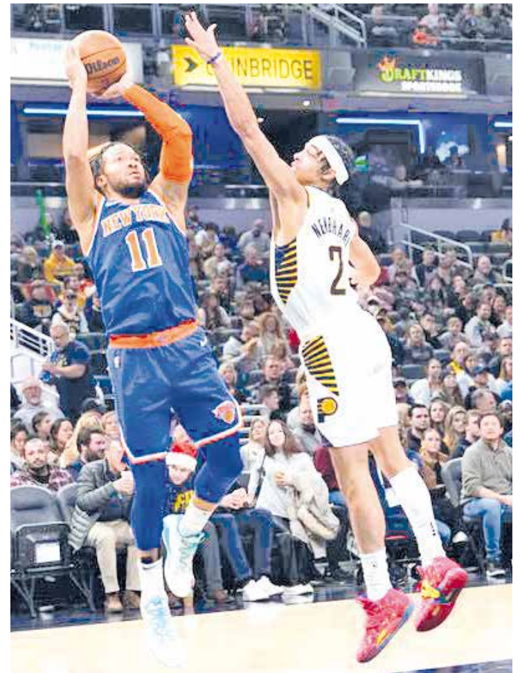
Los Knicks se llevan el triunfo dominero.