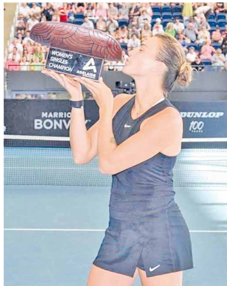
Sabalenka se lleva el campeonato del Adelaida.

Por lo que se encuentra listo para el 15 del presente mes iniciar el Abierto de Australia.