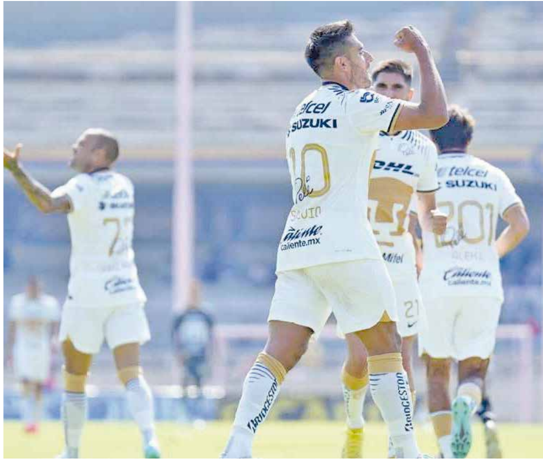
Pumas consigue su primer victoria de la temporada.

FÚTBOL Bravos ganaba con gol de Medina, pero se quedó con diez y los universitarios aprovecharon para ganar.