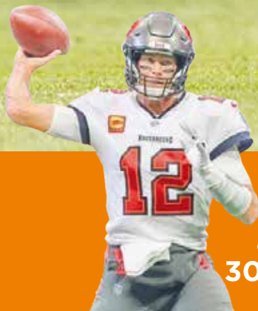
Atlanta frena a Tampa Bay al ganarles 30-17 P.5

Los Pumas lograron remontar a los Bravos de Juárez con destacada actuación de Dani Alves. P.3