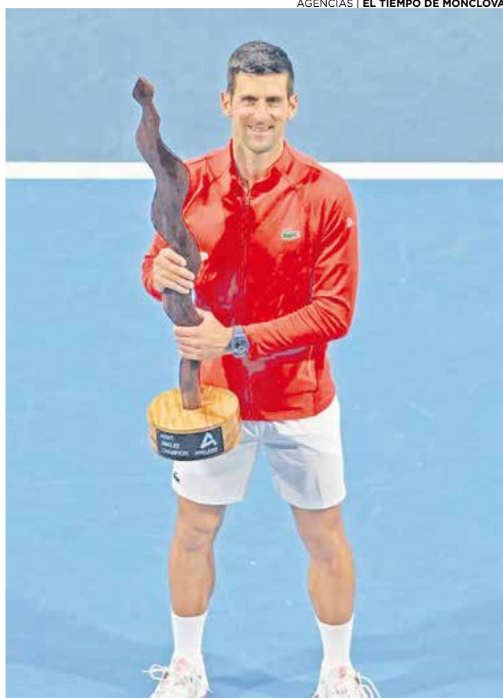
Novak Djokovic campeón de Adelaida.

despliegue físico, ambos mantuvieron el saque hasta el octavo game inclusive. Korda quebró y luego estuvo 40-0 con su saque pero apareció la magia del Djoker: cinco puntos consecutivos y 5-5 en el marcador. Finalmente en el tiebreak, por un ajustado 10-8, el estadounidense se quedaría el primer set.