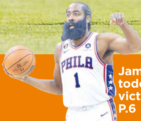
James Harden mostró todo su talento en la victoria de los 76ers P.6