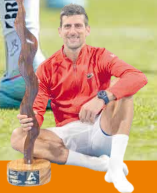
Djokovic es campeón en Adelaida P.8