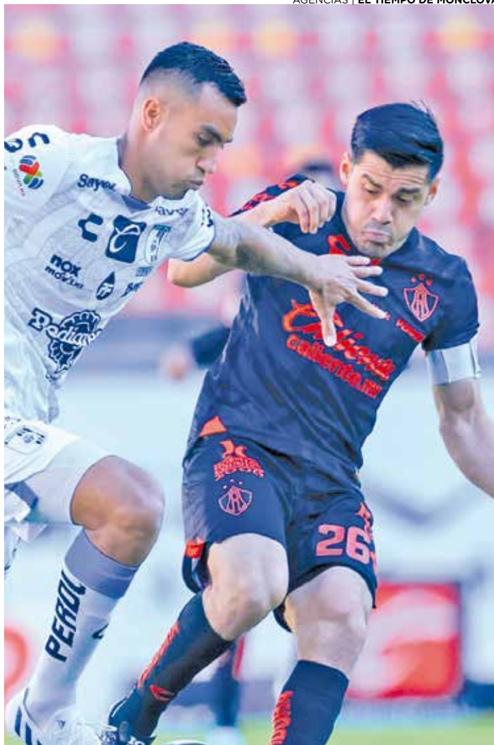
Atlas y Gallos se enfrentan a 323 días de la gresca.