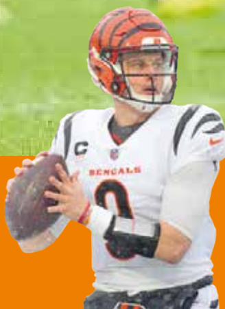
Los Bengals regresan al campeonato de la AFC P.5