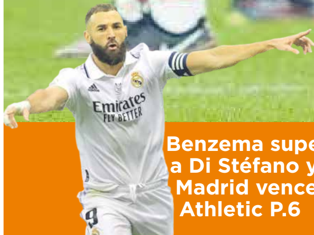
Benzema supera a Di Stéfano y el Madrid vence al Athletic P.6