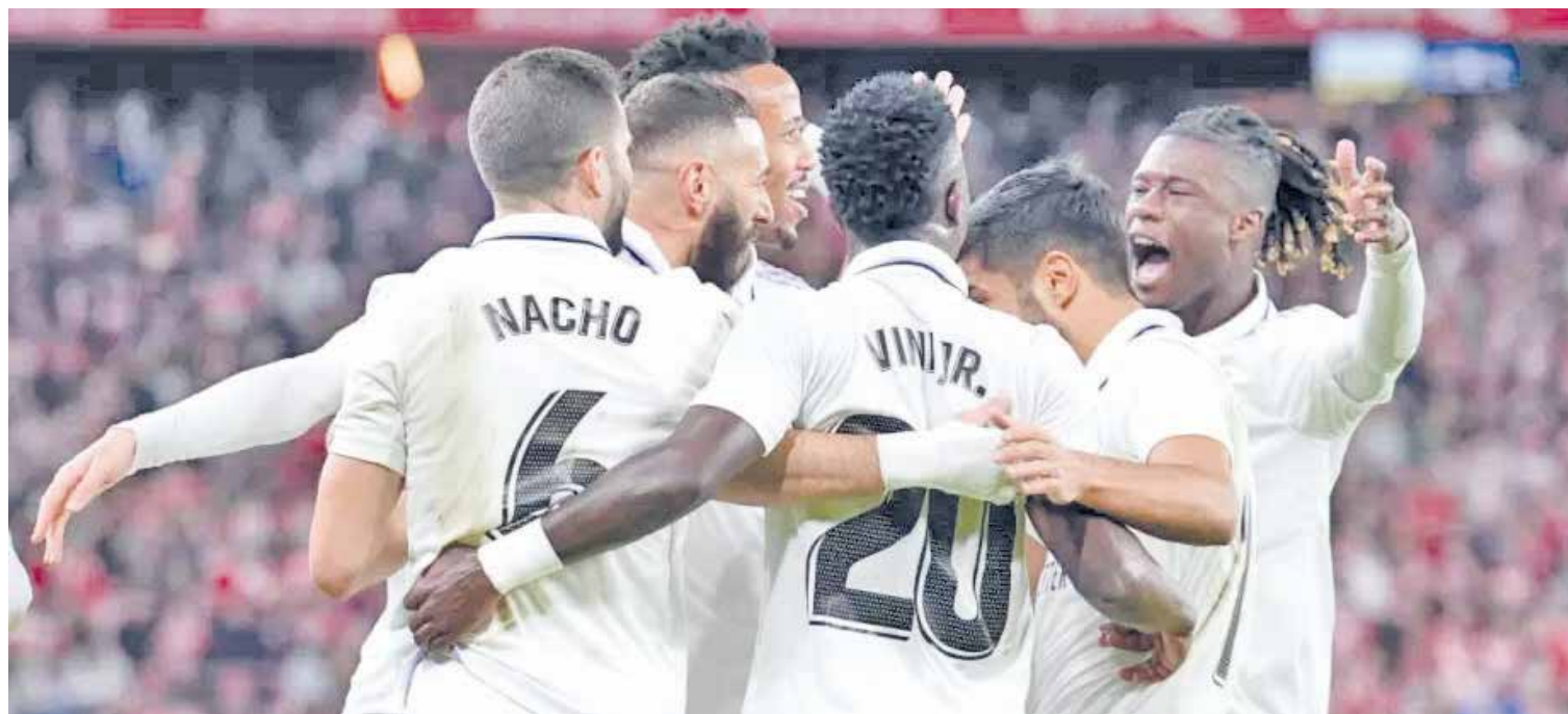
Benzema festeja el triunfo con sus compañeros en San Mamés.

David Soria para salvar en el minuto 85 un gol que no parecía complicado por parte de Kessié y Ter Stegen para detener un remate de cabeza de Latasa en el tiempo añadido.