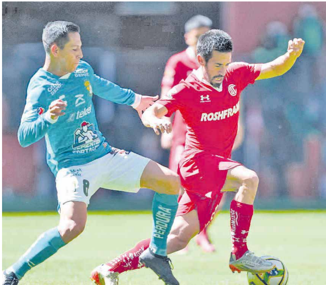
Toluca se trajo un empate con sabor a derrota ante el León.

FÚTBOL Los Diablos Rojos no aprovecharon la superioridad numérica.