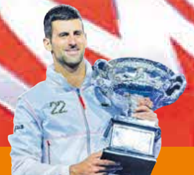
Novak Djokovic se impone a Tsitsipas e iguala a Nadal P.8