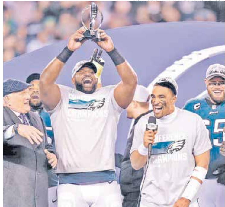
Las Águilas de Filadelfia lograron su pase al Super Bowl tras apalearse a los 49 de San Francisco.