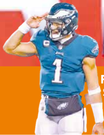
Filadelfia al Super Bowl no tuvo piedad de los 49ers P.4