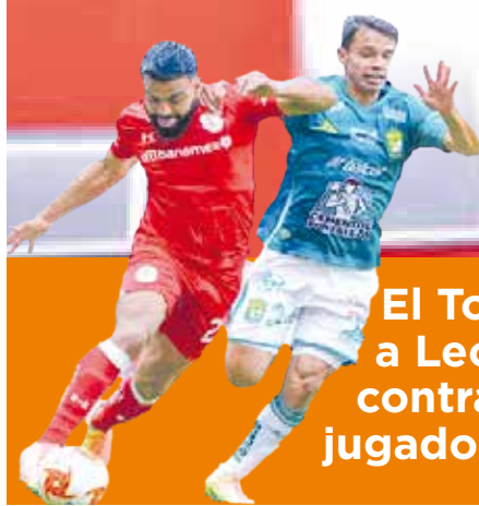
El Toluca empató a León y se traba contra nueve jugadores P.3

En un juego cerrado los Chiefs aprovechan un error defensivo y con gol de campo logran el triunfo del partido. P.5