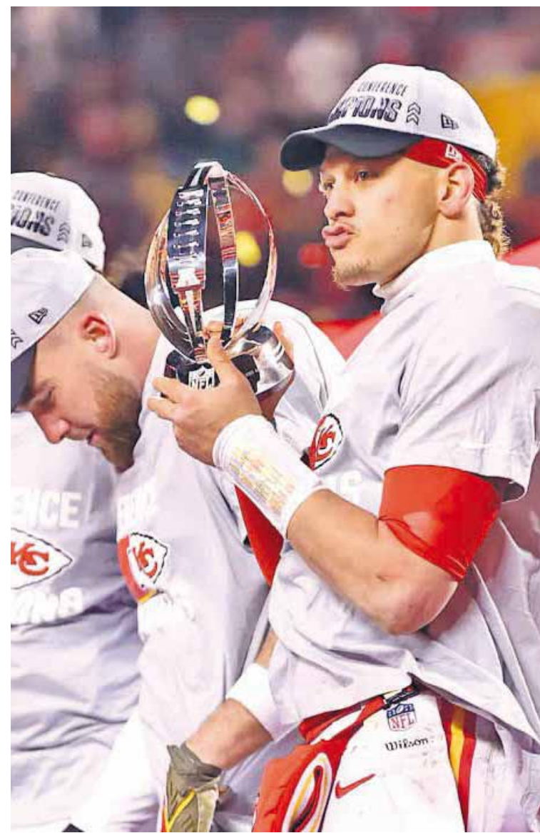
Un error le dio el pase a los Chiefs sobre Bengals.

Con el marcador igualado al último cuarto, los nervios invadieron el Arrowhead Stadium. Mahomes ya no lucía tan seguro y la defensiva rival parecía más cerca de lograr la jugada grande.