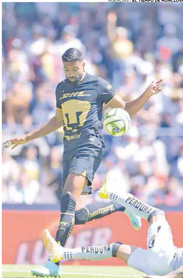
Sin hacerse daño Pumas y Atlas empatan a dos.

El arquero colombiano, incluso, cometió un penal que el árbitro