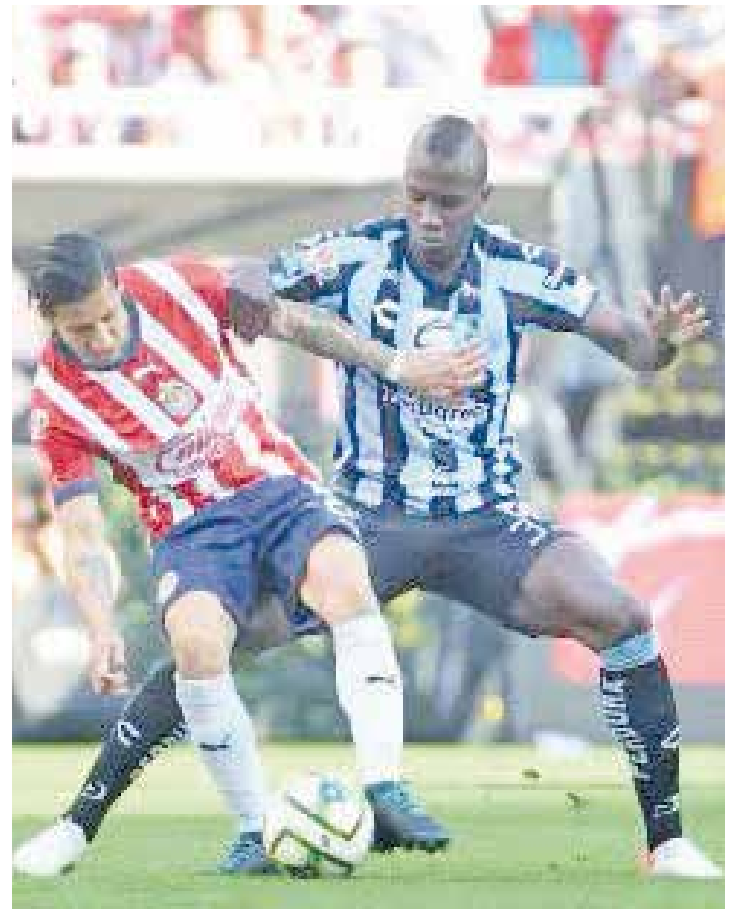
Chivas y Querétaro terminan empatados a uno.