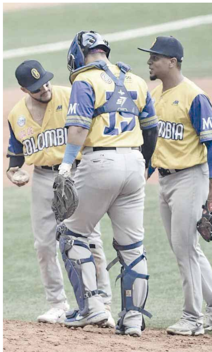
Apretado triunfo de Colombia sobre Curazao.