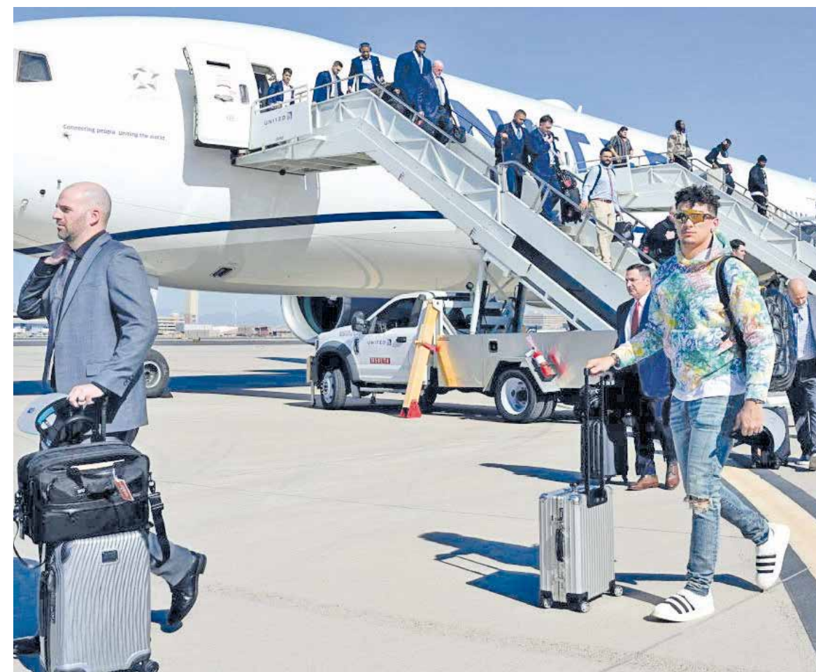
Los Chiefs arribando al aeropuerto de Arizona.

NFL Encabezado por el quarterback estelar Patrick Mahomes.