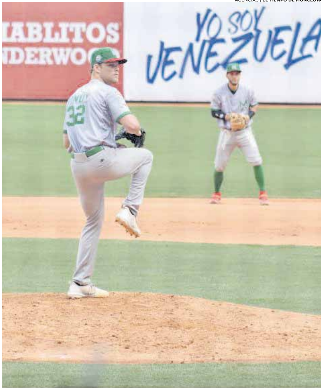
México alcanza y derrota a Cuba.