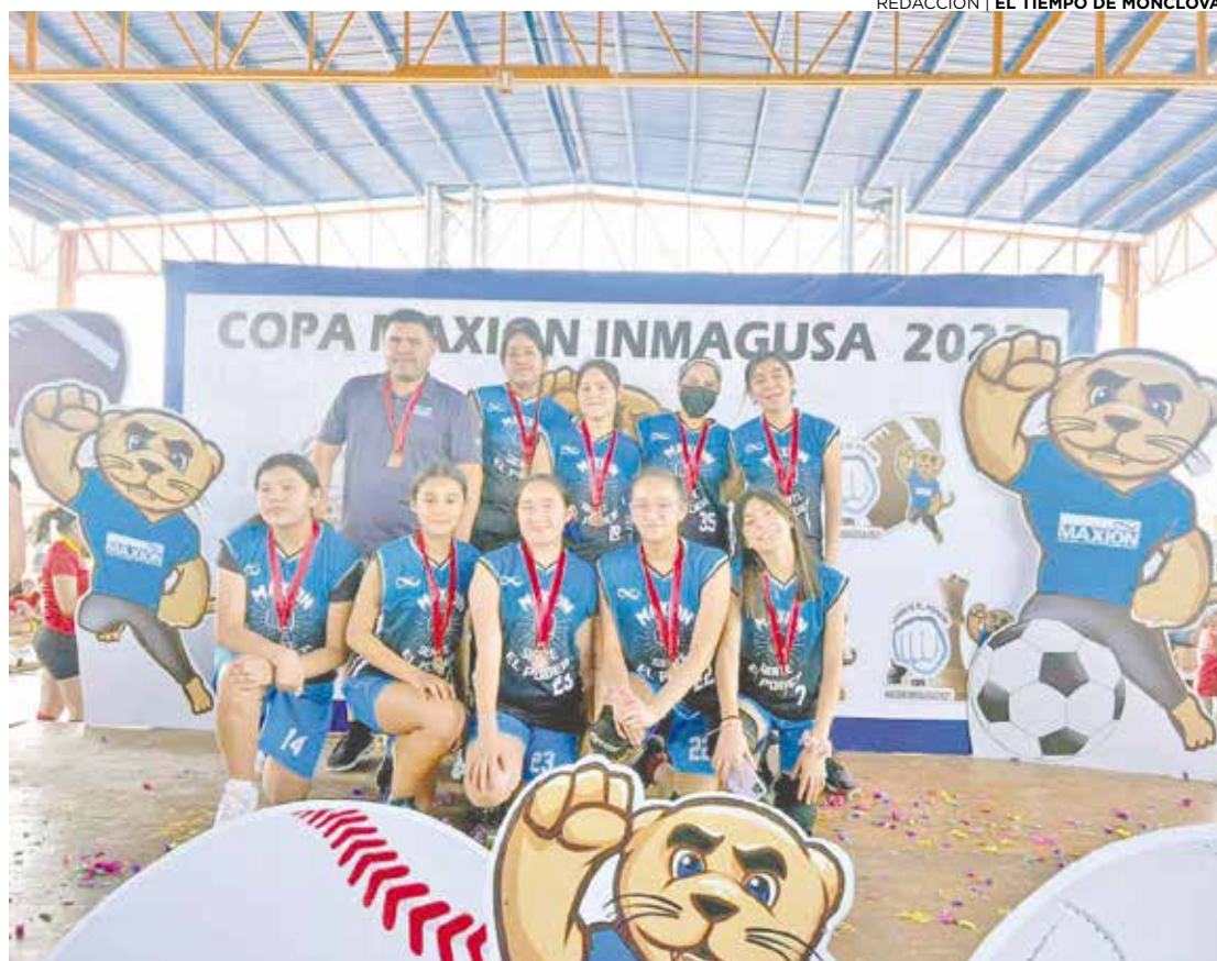
Los campeones recibieron bonitas medallas.

Por otro lado, los dirigidos por Nicolás Larcamón llegan con una racha de ocho partidos sin derrota en Liga MX y están en el segundo lugar de la clasificación, uno por encima del América, por lo que ambas escuadras lucharán por acercarse a la cima donde se sitúan los Rayados de Monterrey.