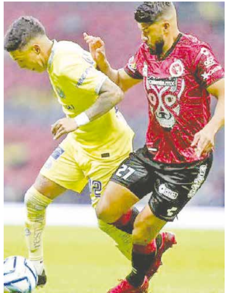
El América logra el triunfo ante los Xolos.

Fútbol 2017-2018, primero Colegio Vivir, segundo Maxion y en tercero el México Americano.