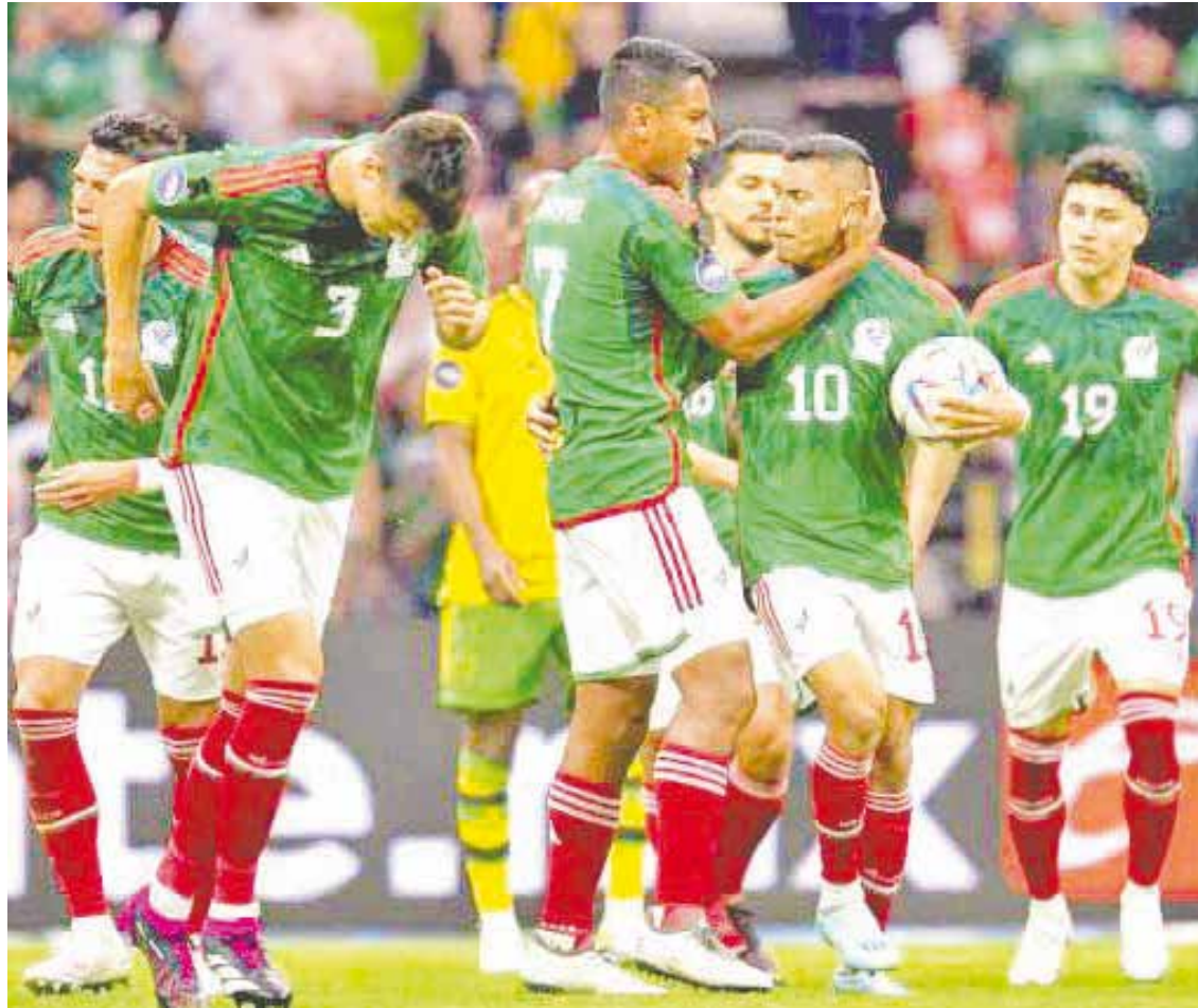
La Selección Mexicana logra un gris empate ante la de Jamaica.

FÚTBOL El Tri sufrió mucho en casa pero se mete a las semifinales de la Concacaf Nations League.