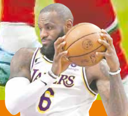
En la vuelta de LeBron, los Lakers cayeron ante Bulls P.6