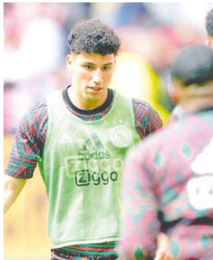
Los mexicanos jugaron en el triunfo del Ajax.

Con el juego decidido apareció Julen Lobete para definir un contragolpe y marcar el tanto de la honra del Waalwijk.