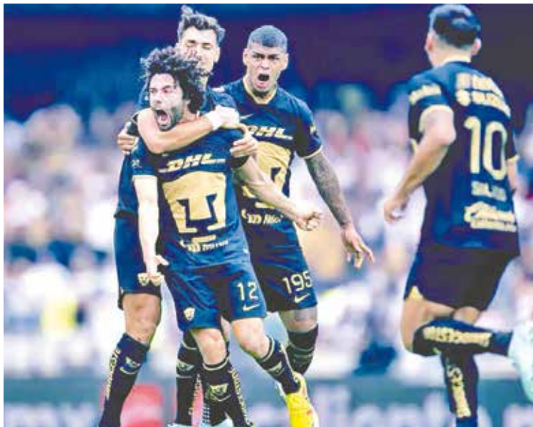
Los Pumas ganan en casa al San Luis.