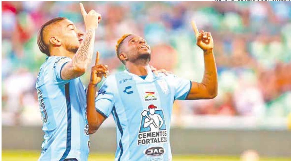
El Pachuca 'arrolló' al Santos Laguna en su propia casa.