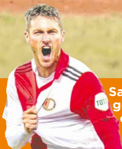
Santi se mandó gol y asistencia en gane del Feyenoord P.4