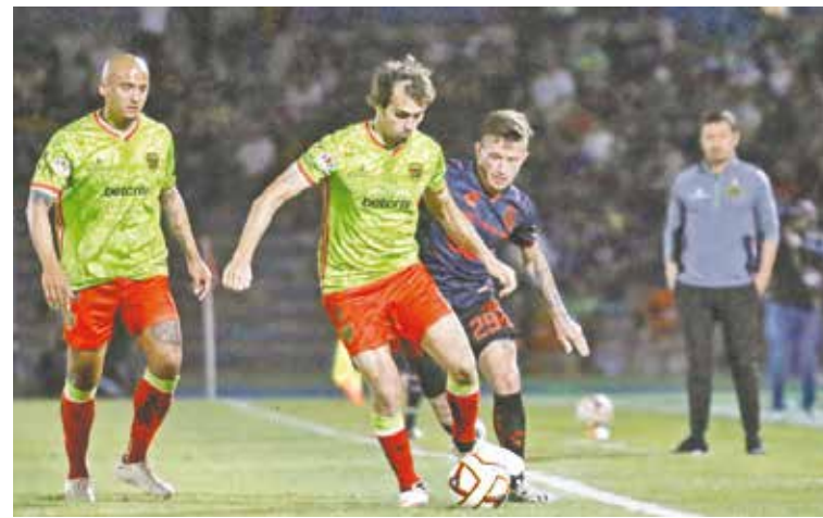
Sin hacerse daño los Bravos y el Atlas.

Regresó la luz, pero no Santos. Pachuca, en su paseo por la Comarca Lagunera, anotó el 4-1, cortesía de Israel Luna. Lo que provocó el abucheo contra los blanquiverdes, aún con posibilidades de repechaje, pero fácilmente superados por los Tuzos.