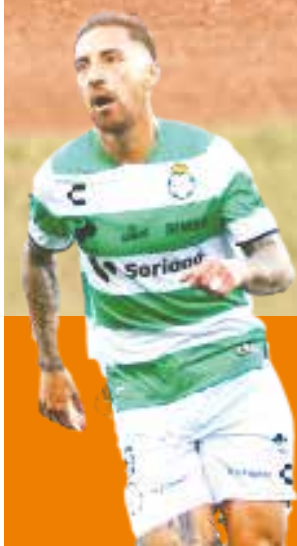
Pachuca provoca el abucheo en contra de Santos en el Corona P.3