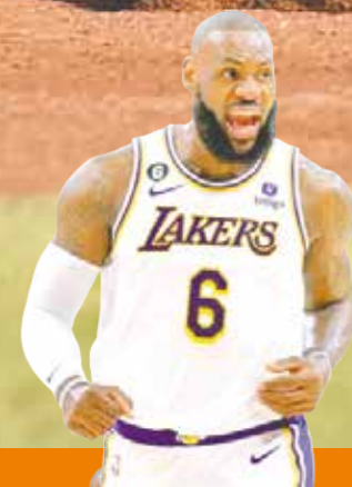
iShow de LeBron James para el triunfo de los Lakers! P.5