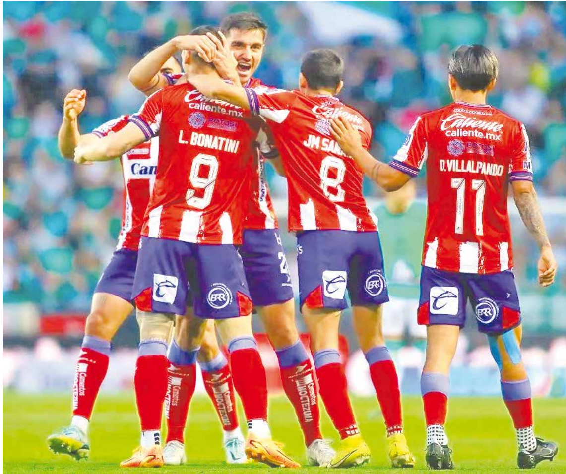
Atlético San Luis elimina al favorito León del repechaje.

FÚTBOL El conjunto potosino supera como visitante a la escuadra esmeralda y se une al Atlas y Santos.