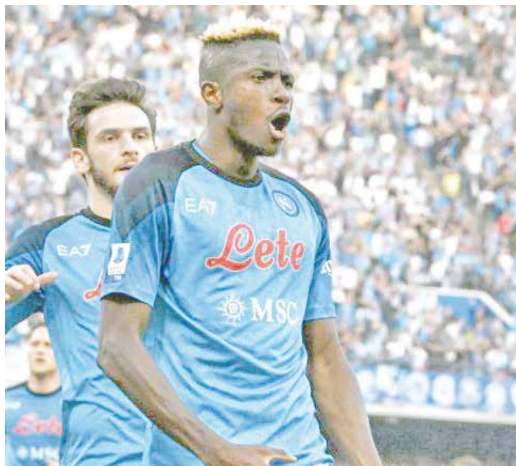
Napoli gana al Fiorentina pero pierde a Chuky.

Samuel Iling-Junior estrenó su cuenta goleadora en su debut con el primer equipo de la Juventus