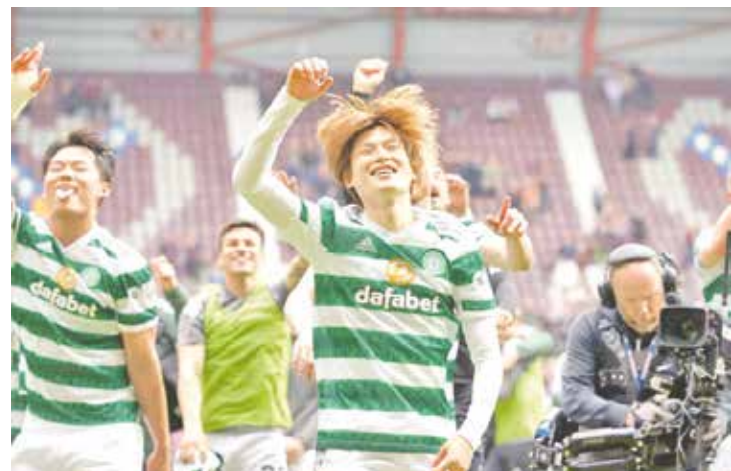
Los Celtics se coronaron ante los Rangers.

chas de Atalanta, lo cual provocó que el partido fuera interrumpido brevemente. Fue apenas la segunda victoria de la Juventus en siete partidos y permitió que los Bianconeri desplazaran a la Lazio, que el sábado perdió 2-0 en su visita al Milan en una reñida pugna por figurar entre los cuatro primeros de la liga italiana.