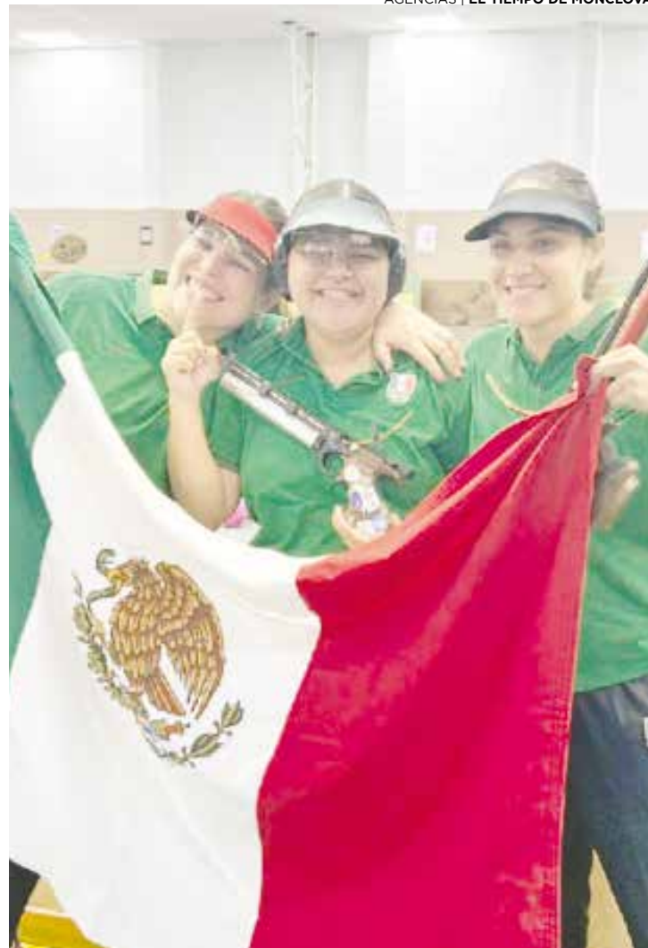
Oro para México en tiro deportivo.