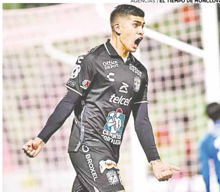
Santos sigue mal y de malas, ahora pierde ante el León.

Los siete minutos que decidieron agregar del primer tiempo fueron muy benéficos para el equipo visitante, pues cuando estaban en