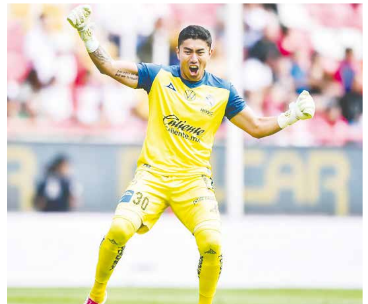
Puebla venció al Necaxa con marcador de 2-1.