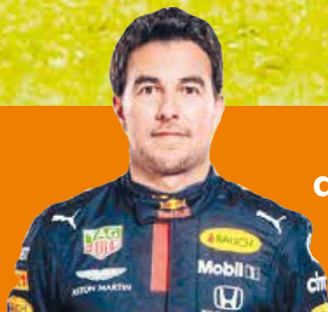
Checo Pérez queda fuera del GP de Arabia Saudita P.8