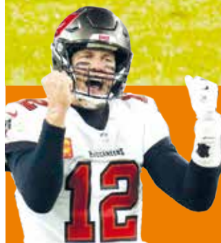
Buccaneers supera a domicilio a los Falcons P.5

Por primera vez en la historia del fútbol mexicano se enfrentan estos equipos en una final súper pareja. Pag. 3