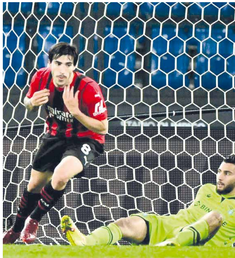
El Milan favorito para llevarse el título.

ACCIONES El Milan salvó el partido más complicado que le queda hasta el final de campaña con una remontada.