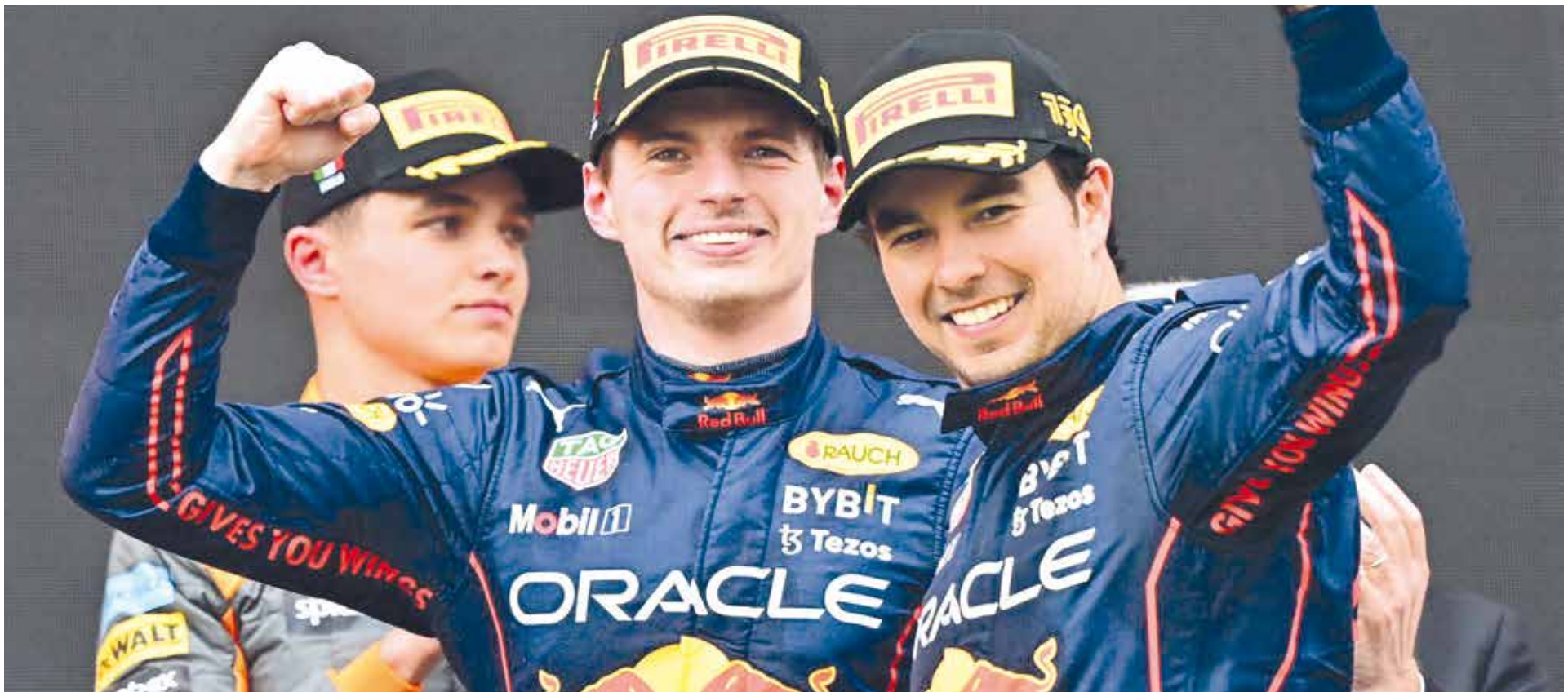
Red Bull hizo el uno-dos en el Gran Premio de Emilia Romagna.