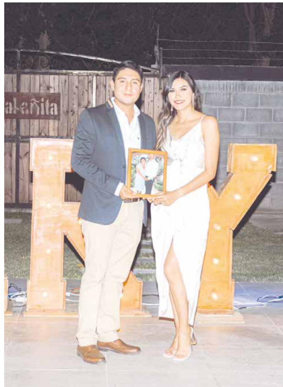
Sus rostros estaban llenos de emoción, recordando a aquellos familiares que se fueron de este mundo, pero los acompañarán desde sus corazones.