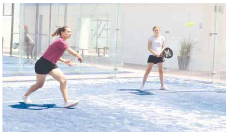
Las participantes de brindaban apoyo unas a otras, jugando excelente.

La mamás y sus Jóvenes hijas se mantuvieron con una gran actitud, dando lo mejor de ellas, con el objetivo de poder disfrutar de su gran momento.