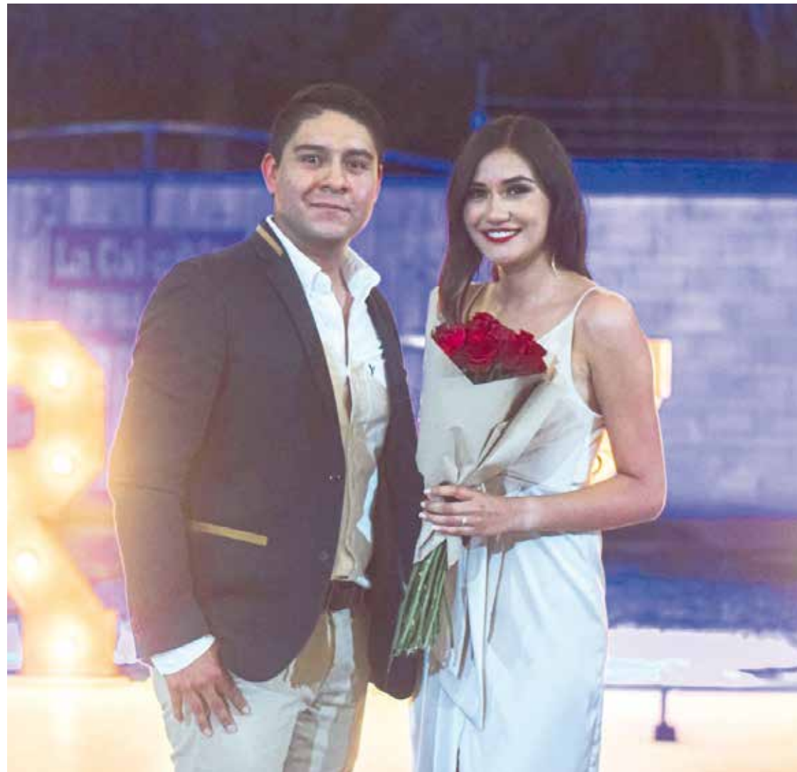
Las flores son un detalle hermoso que la prometida adora recibir por parte de quien se convertirá en su futuro esposo.