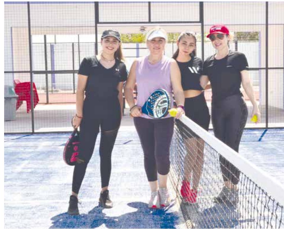
Los equipos contrincantes estuvieron con una actitud 100% positiva.