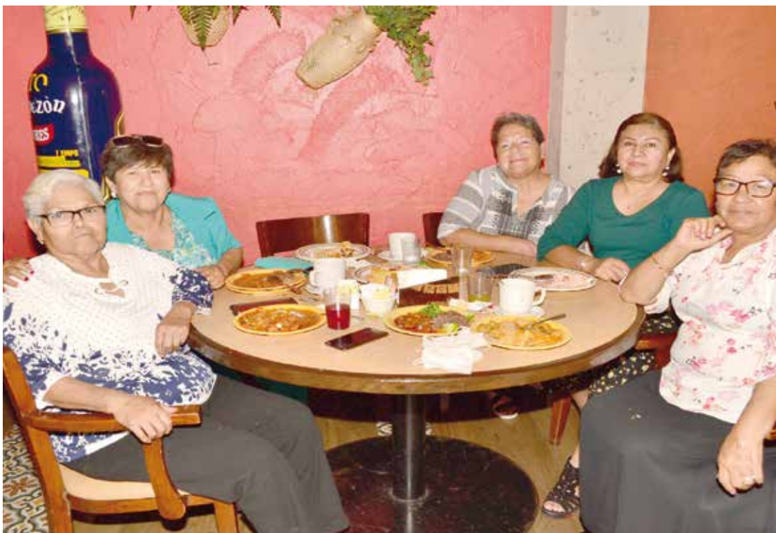
Las reinas del hogar merecen celebrar su día especial al lado de otras madres que han entregado su vida para criar a sus hijos con amor.