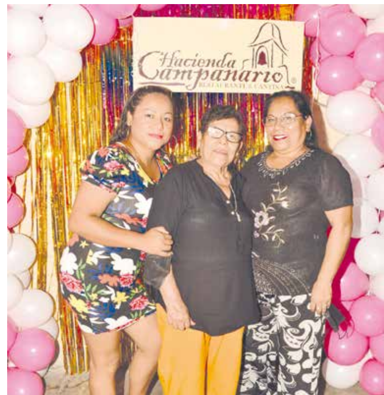
3 mamis felices luego de haber disfrutado de una cena familiar donde cada una festejó su día.