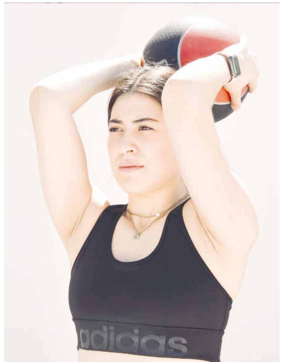
Se realizan ejercicios de fuerza con artículos de peso y bajo impacto.