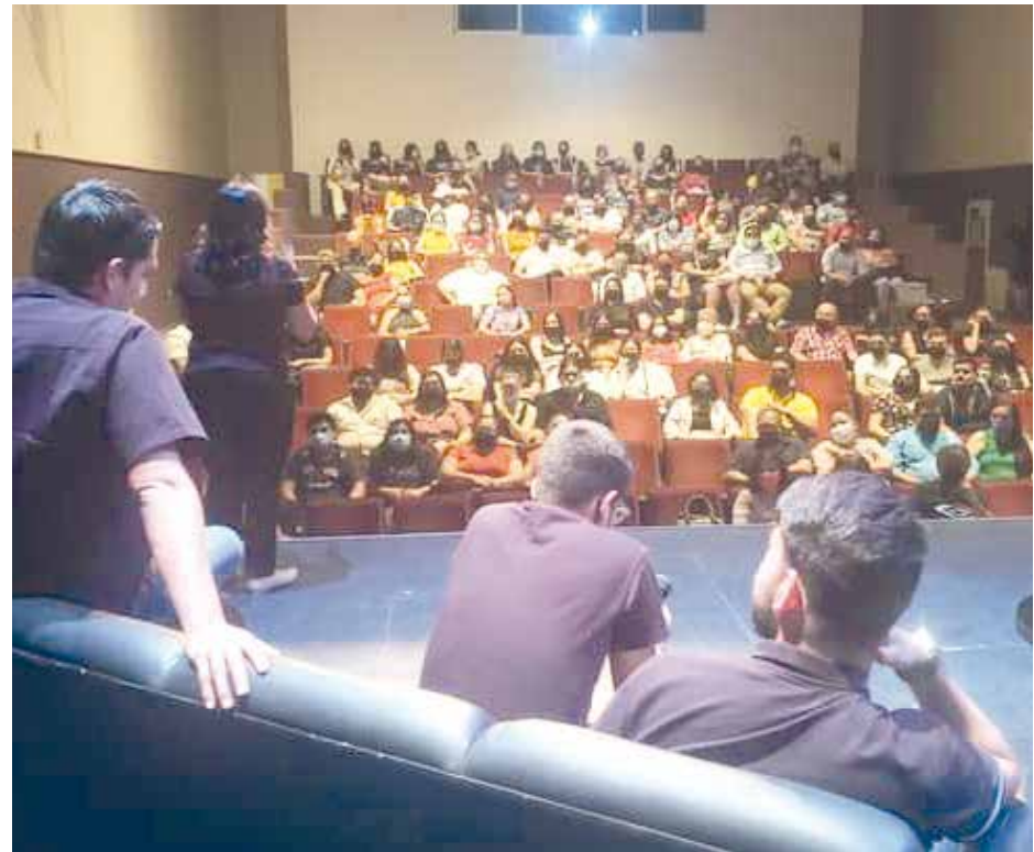
Se tuvo una gran respuesta por parte del público, pues el teatro se encontraba con sala llena.