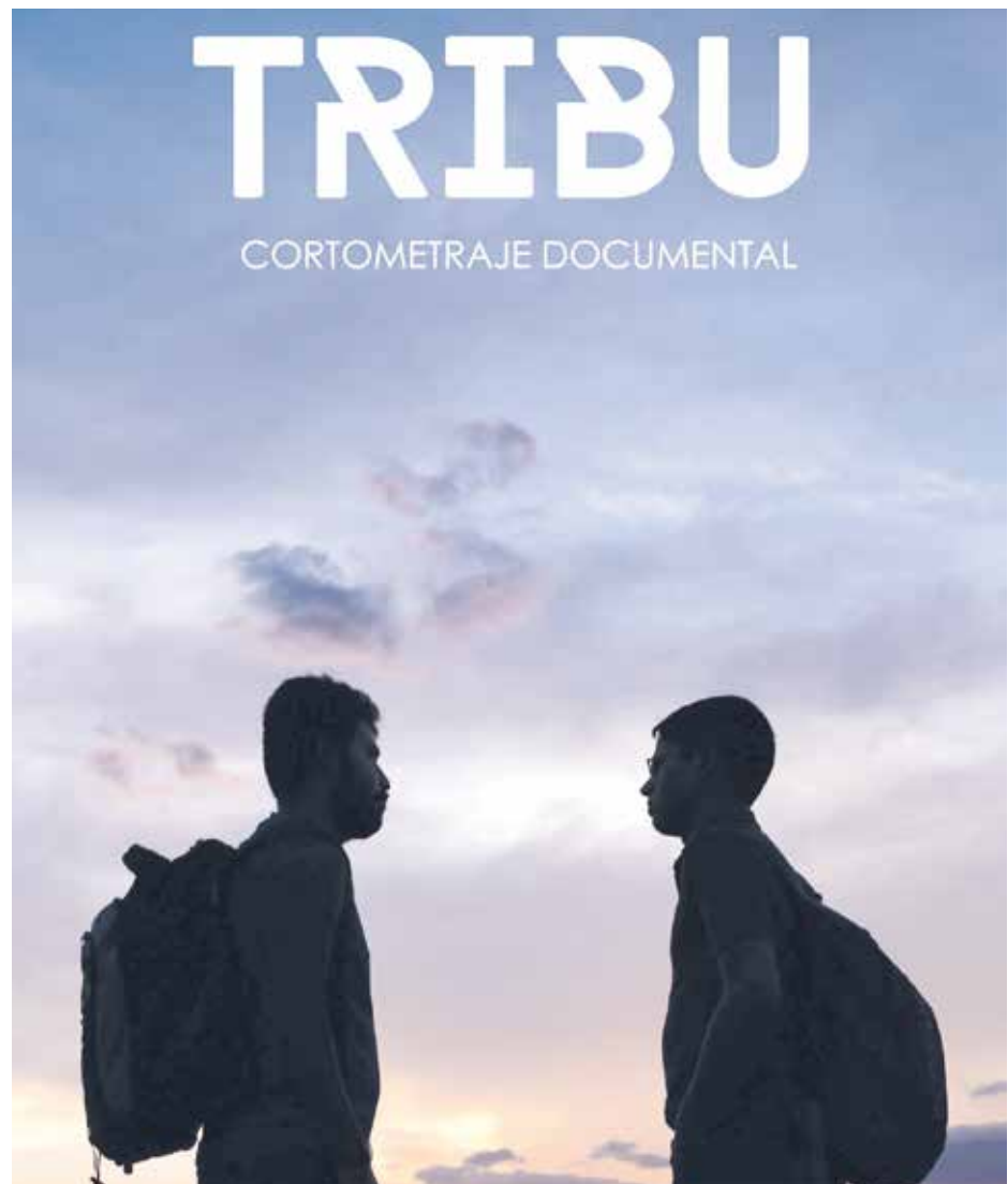
Buscan promover la adopción de adolescentes.

El filme habla de 2 menores con personalidades muy contrastantes entre sí y fueron adoptados cuando tenían 13 y 17 años de edad y actualmente tienen la edad de 16 y 20 años.