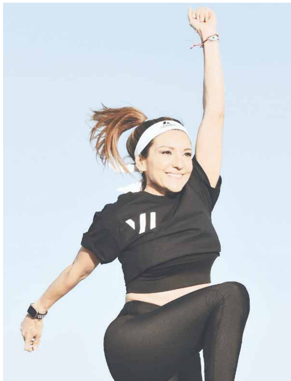
El cardio con peso propio es clave para poder comenzar con una vida fitness.