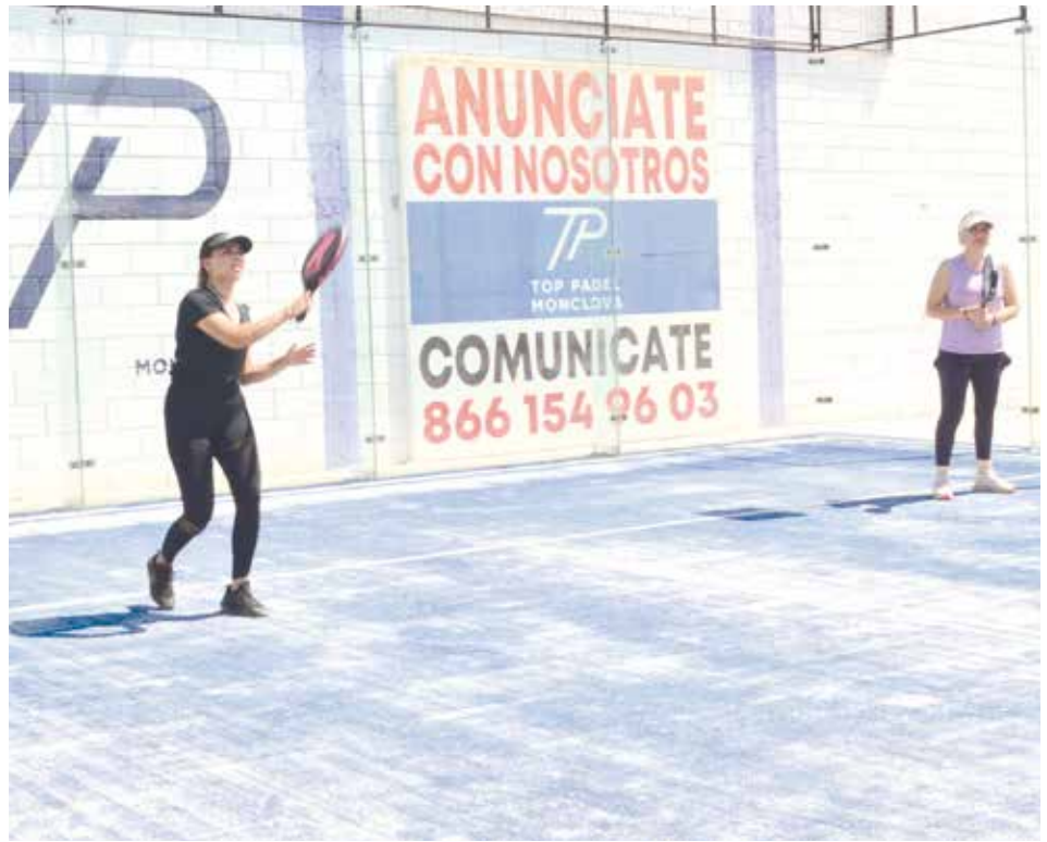
La competencia fue completamente sana.