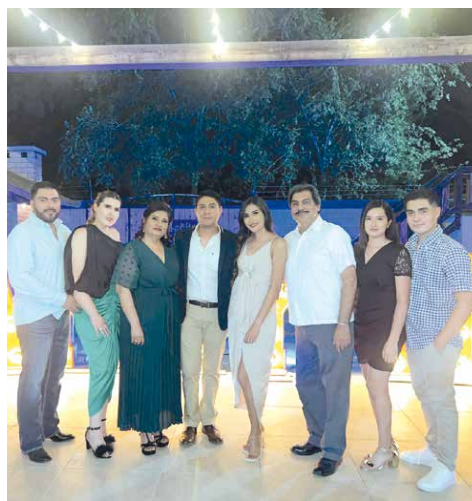
Los prometidos acompañados por sus padres, hermanos y cuñados, en un día de felicidad y alegría.

La solicitud y evento tan emotivo, se llevó a cabo el pasado fin de semana, los ahora prometidos estuvieron acompañados por las personas más especiales que rodean sus vidas, tales como sus padres, hermanos y presupuesto amigos más cercanos, quienes serán los invitados de honor en el día más especial de sus vidas, el cuál será su boda.