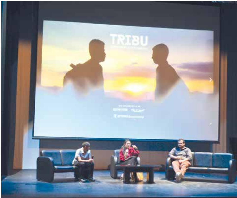
El filme fue posible gracias a la participación de un productor y un director monclovenses.