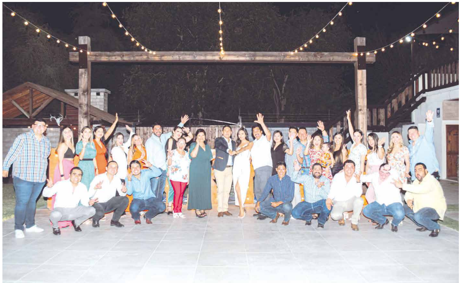
Las personas más especiales que han marcado la vida de los prometidos son quienes los acompañaron en la propuesta de matrimonio y así mismo lo harán el día de su boda.