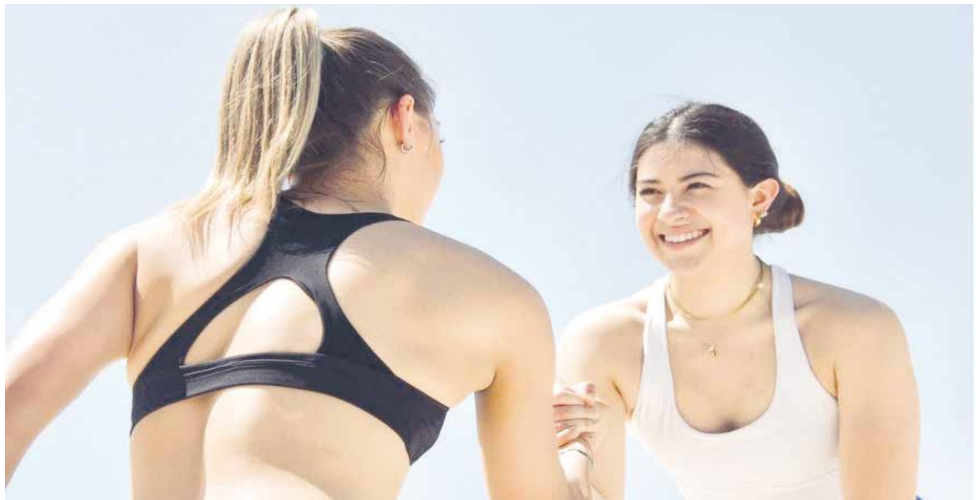
Switch Society Monclova brinda clases funcionales para tonificar y crear muslo.