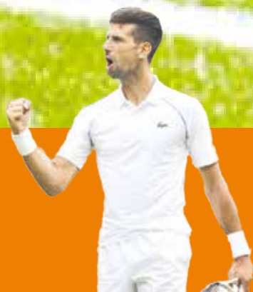
Djokovic gana su Grand Slam número 21 P.5

El Toluca con un marcador de 3-0 termina por ganar al bicampeón Atlas con cuenta final de 3-2. pág. 3