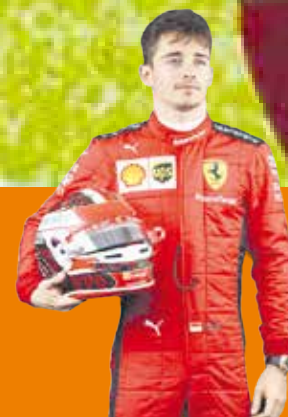
Leclerc ganó a Red Bull en Austria P.8