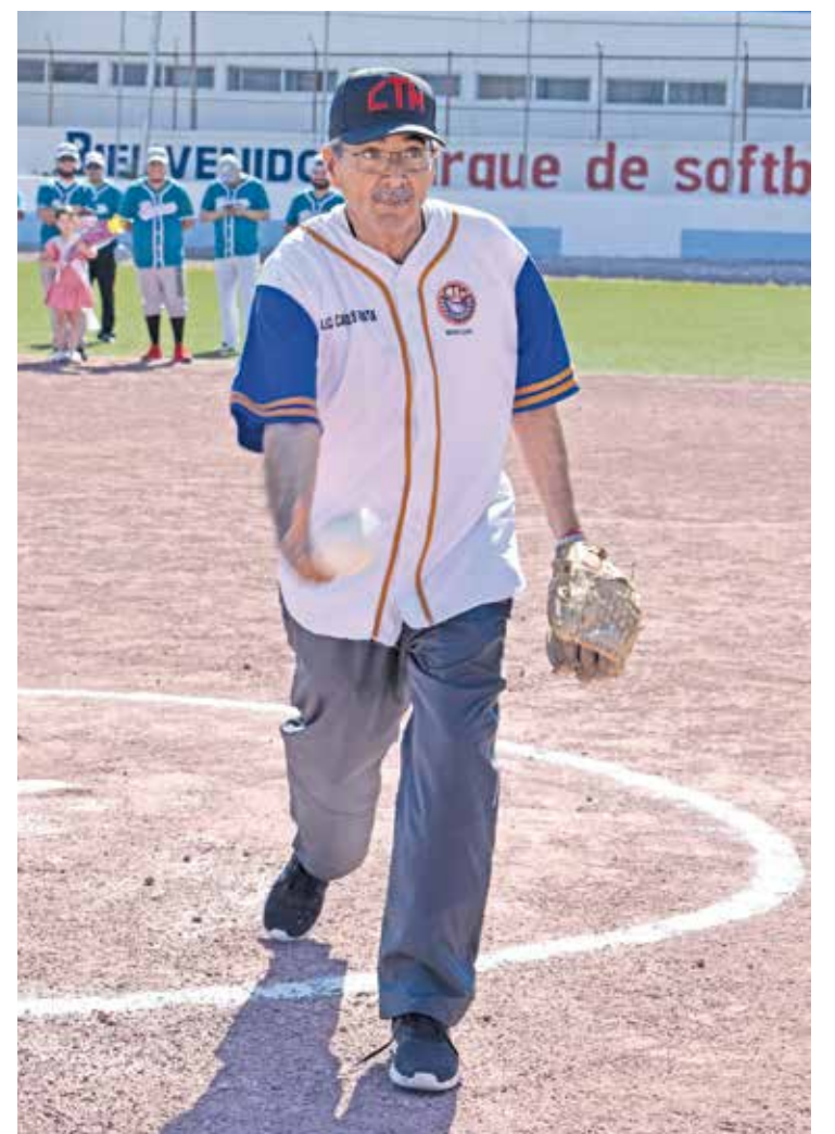
Aquí se efectuaba el primer lanzamiento.