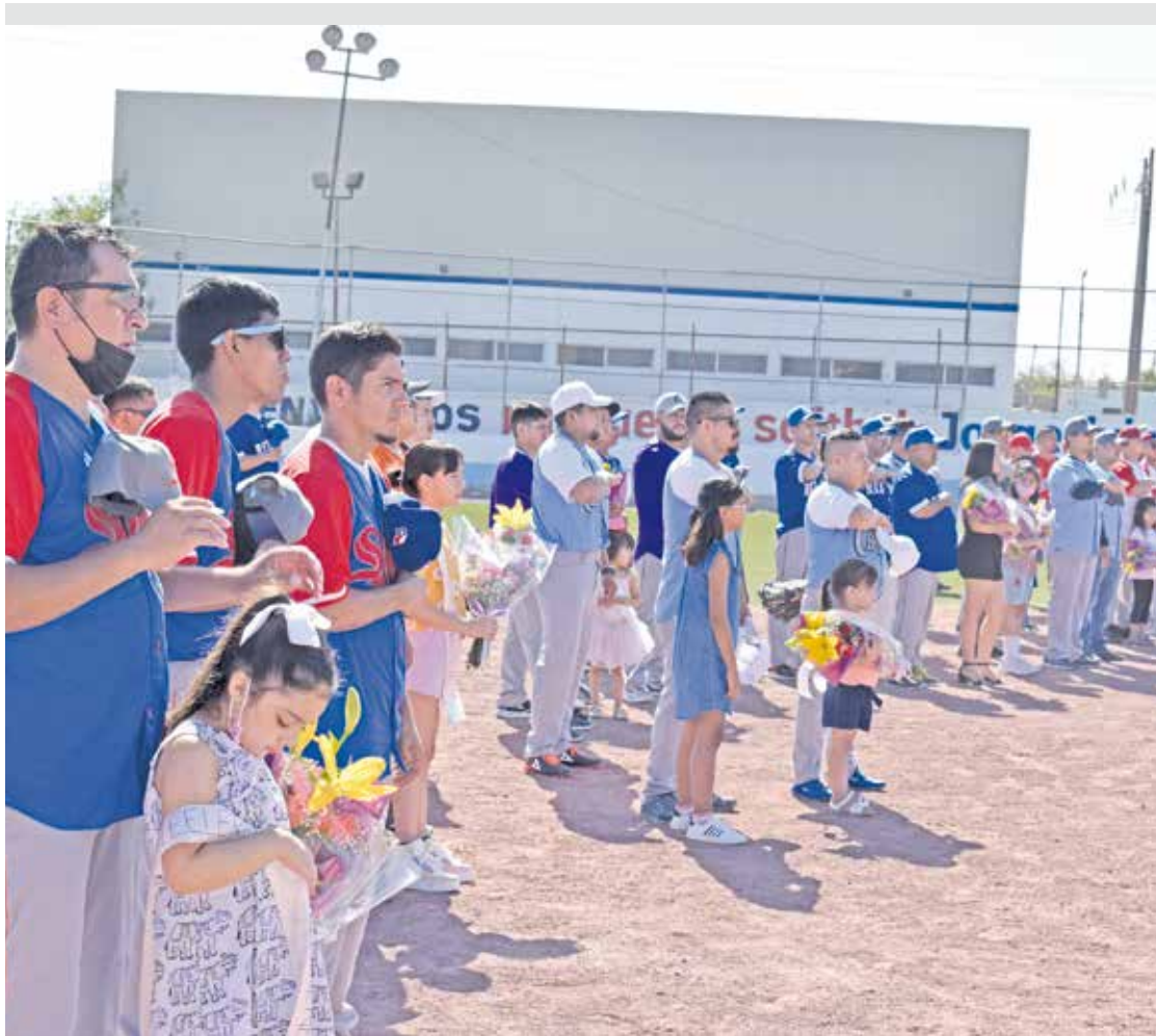
Los equipos participantes en el Sóftbol de Trinity.

SÓFTBOL Nuevamente se reanuda la actividad deportiva en Trinity.