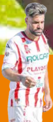
Necaxa logra triunfo ante Querétaro 1-0 P.3