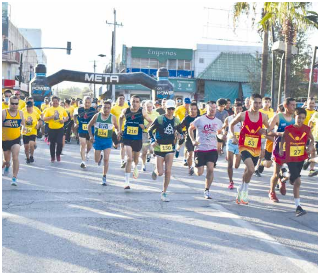
Instantes en que hacían su salida los atletas participantes.

ATLETISMO Una vez más se llevó a cabo la tradicional carrera.