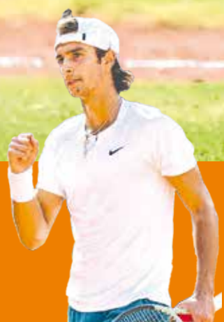
Lorenzo Musetti consigue el Open de Hamburgo P.2

Los Acereros le ganan el tercer juego a los Bravos y les completan la barrida, su séptima de la temporada. Pág. 5