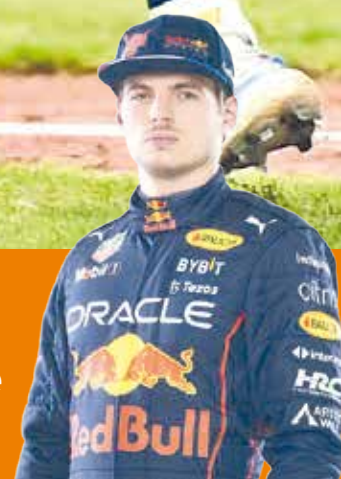
Max triunfa en el Gran Premio de Francia P.8