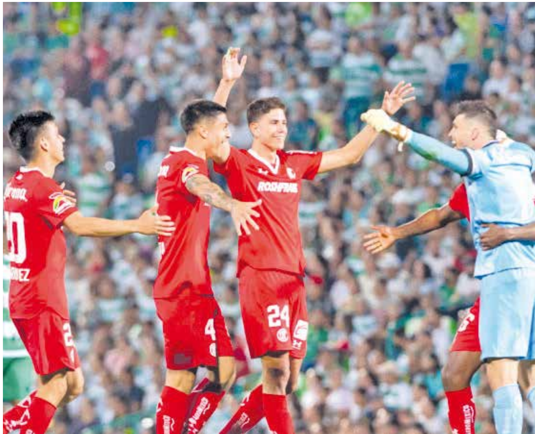
El Toluca fue superior al Santos en los dos partidos.

FÚTBOL Los Diablos aprovecharon la ventaja y ganaron de visitantes y ahora avanzan a semifinales.