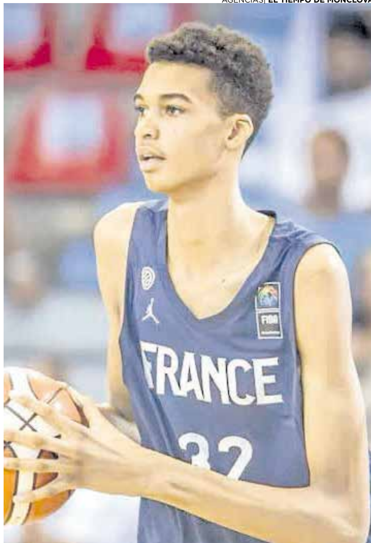
Victor Wembanyama, podría ser reclutado.

Houston Rockets. Lamentablemente, el lamento del guardia veterano Eric Gordon de que "no ha habido mejora" por parte de