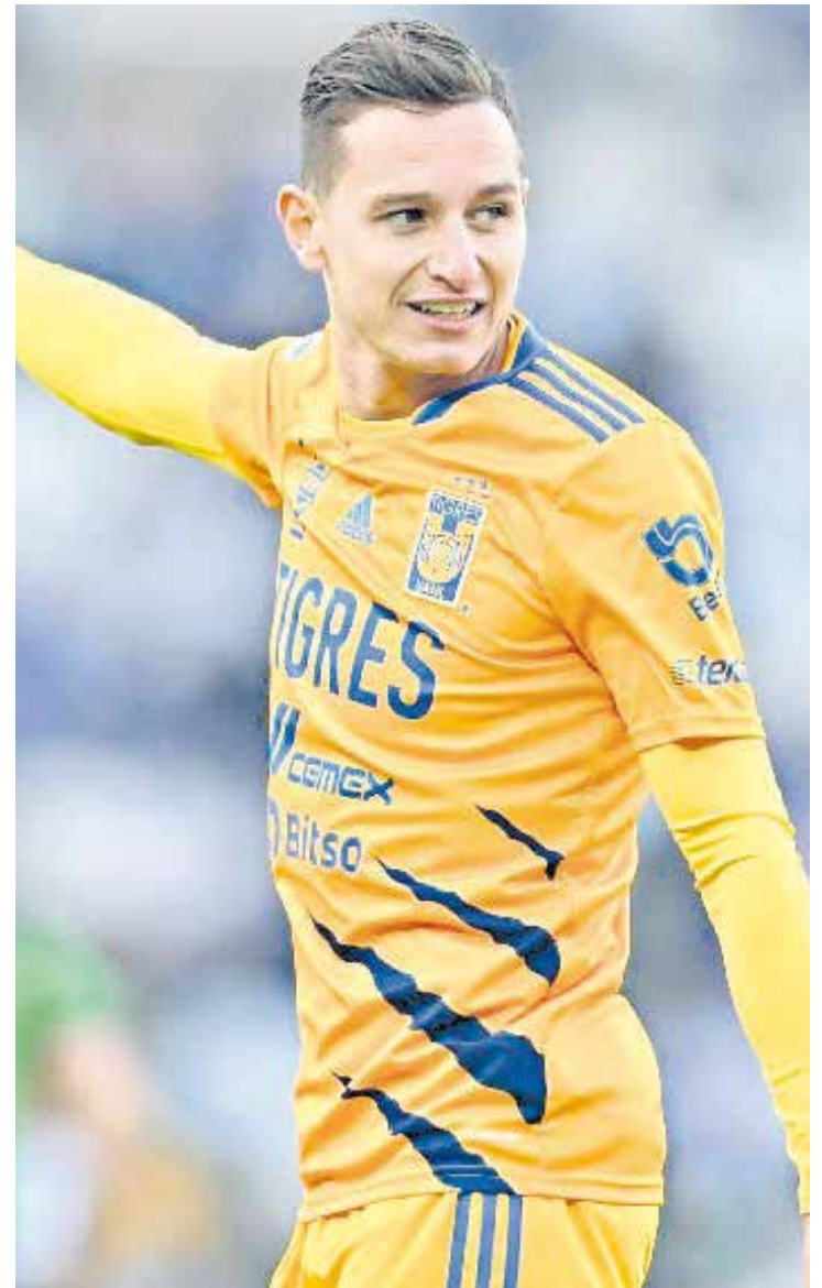
El futbolista francés llegó como la contratación más cara.

Carrera. Florian Tristan Mariano Thauvin (nacido el 26 de enero de 1993) es un futbolista profesional francés que juega como lateral en el club Tigres UANL de la Liga MX. Hizo su debut profesional con Grenoble en 2011, luego se mudó a Bastia, donde ganó el título de la Ligue 2 en su primera temporada y fue nombrado Jugador Joven del Año un año después. Luego se mudó a Marsella por 15 millones de euros, luego hizo más de 281 apariciones y marcó 86 goles en dos períodos en el equipo, con un breve tiempo en el Newcastle United de la Premier League en el medio.