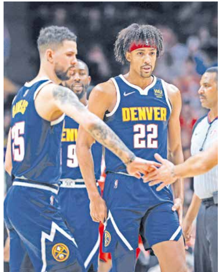
Denver Nuggets tienen buena racha.