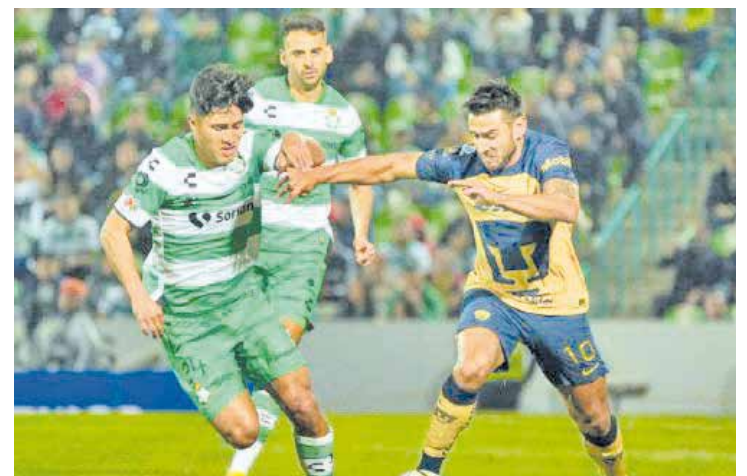
Ambos equipos han contratado refuerzos para el torneo.

el 3-1. A los 86 minutos, los felinos sellaron la victoria, luego que Gignac tomó la pelota y se enfiló hacia la portería rival, dio pase a Quiñones, quien puso el 4-1 y con ello obtuvieron los tres puntos para llegar a seis en la actual justa. Los Tuzos no contaron con su delantero Nicolás Ibáñez, que llegará como refuerzo a los Tigres y que desde el partido de esta noche ya ayudó a la causa de Cocca, al no estar en la convocatoria del juego.