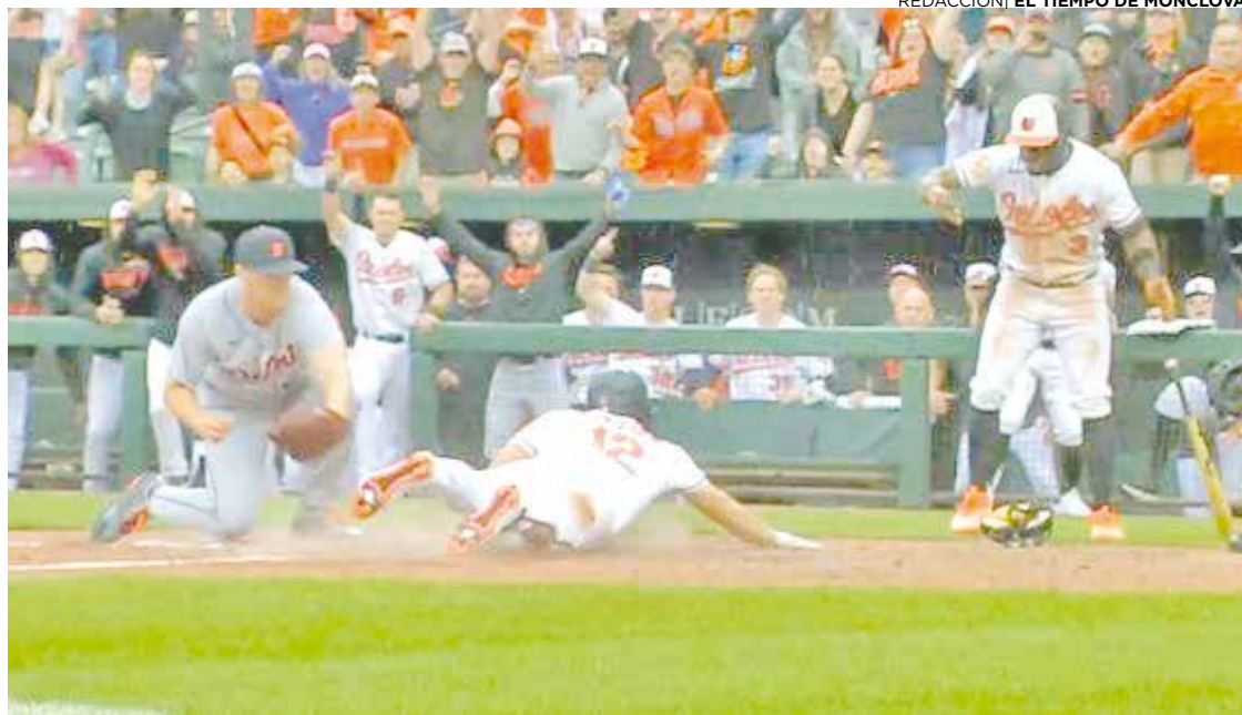
Orioles ganan en juego de 10 entradas.

Es la racha más larga de Pittsburgh desde que ganó 11 compromisos seguidos en 2018. David Bednar ponchó a dos en el noveno inning para su octavo salvamento, terminando con cuatro hits.