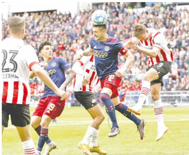
Victoria del Guti y el PSV.

El segundo tiempo inició, el goleador de los granjeros Xavi Simons intercambié el penalti por gol para poner a su equipo dos tantos arri-