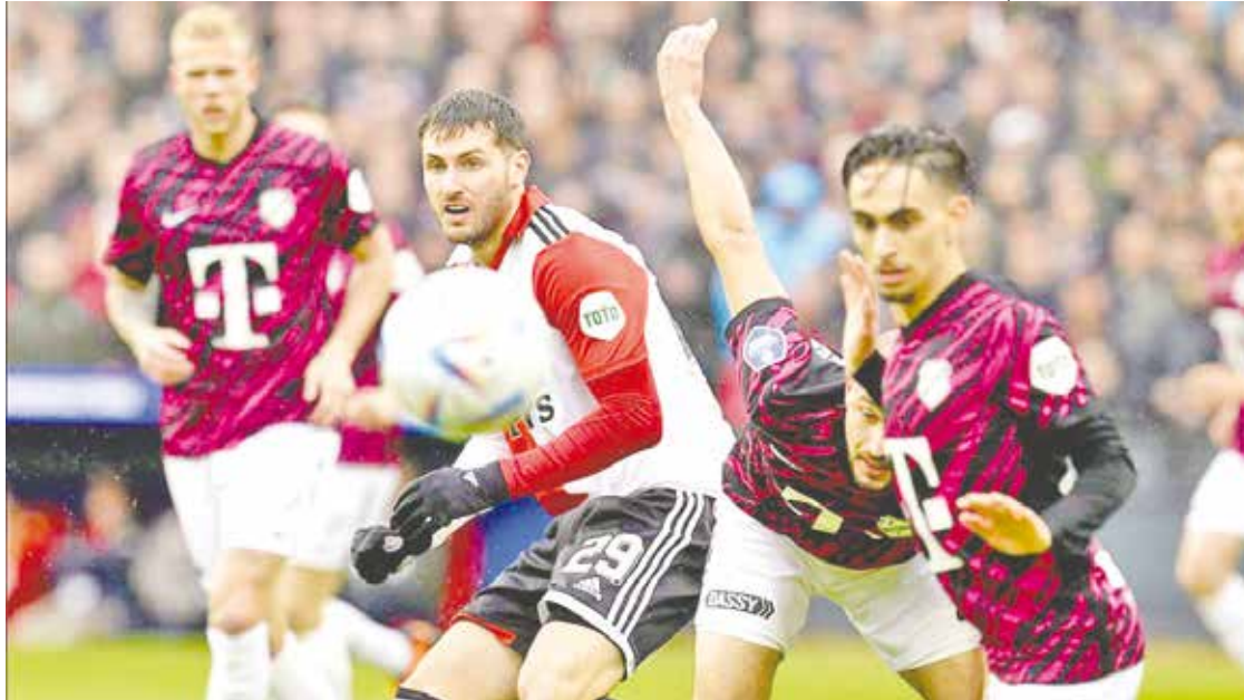
Santi Giménez guió al triunfo al Feyenoord con su gol número 20.