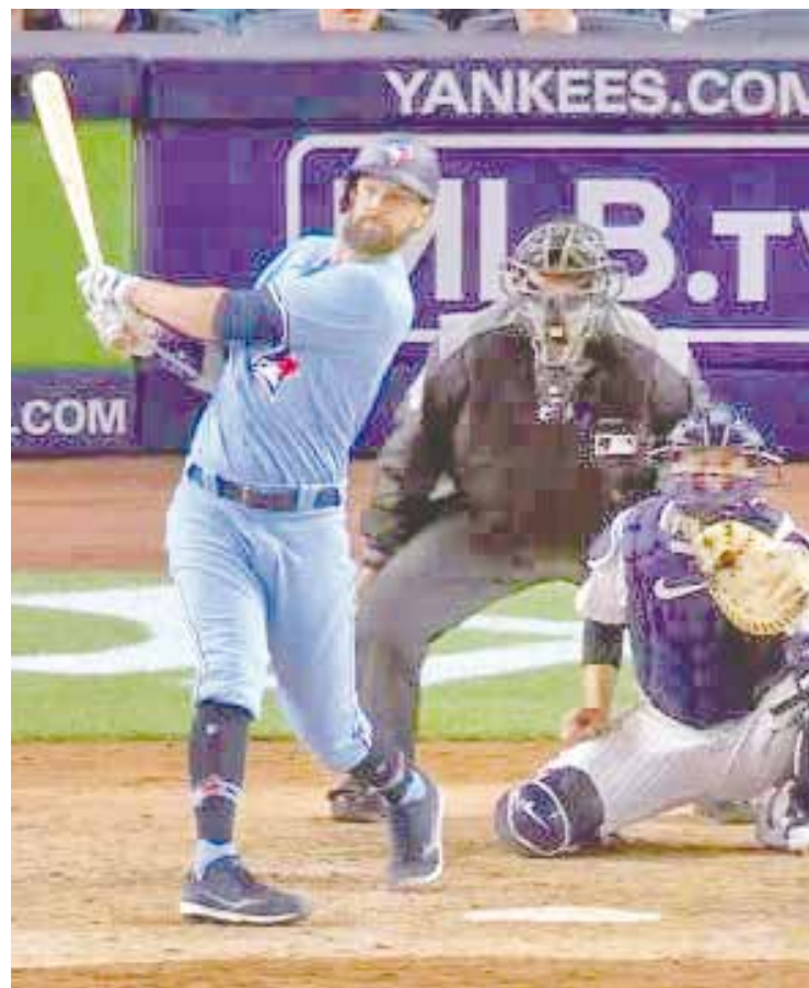
Los Blue Jays siguen ganando ahora por 5-1

Otra señal positiva ha sido una mejoría en la producción de poder del equipo. Un día después de que Nick Castellanos y Christian Pache conectaron sus primeros jonrones de la temporada, Turner y Clemens también pusieron fin a su sequía.