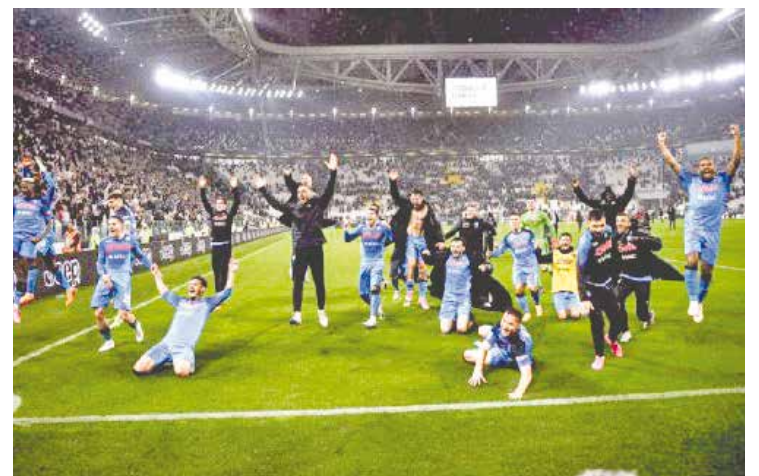
Napoli le gana al Juvetus y está a un paso del título.

Con este resultado, el Ajax de Amsterdam se quedó con 62 puntos, 10 menos que el Feyenoord que tiene un partido en puerta ante el Utrecht este mismo domingo. Y con cuatro jornadas por disputarse tendrían que esperar un autentico fracaso del equipo de Santi Giménez sin una sola victoria lo que resta de la temporada para poder alzar el título.