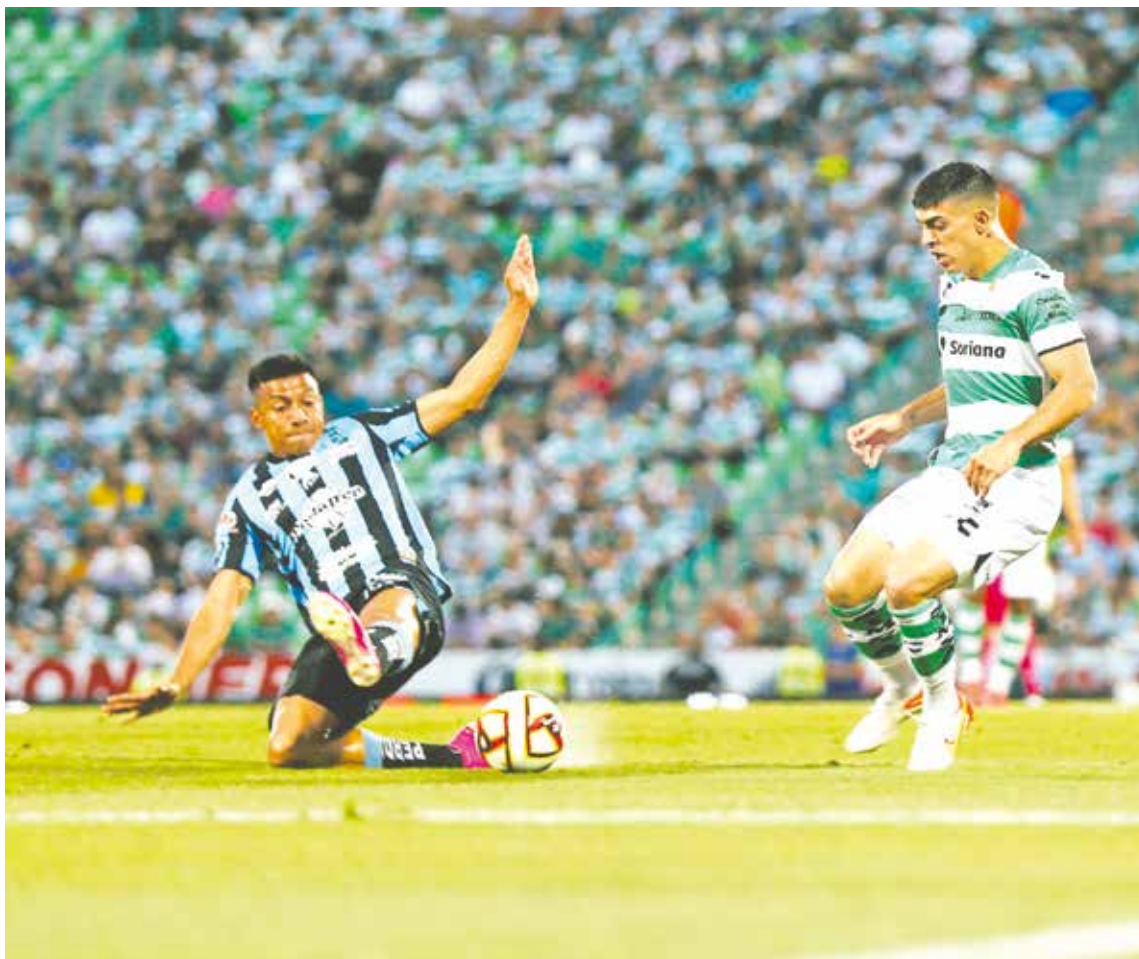
El Santos entró en crisis al perder ahora ante Querétaro.

FÚTBOL Los Guerreros perdieron la oportunidad de amarrar el pase al Repechaje.